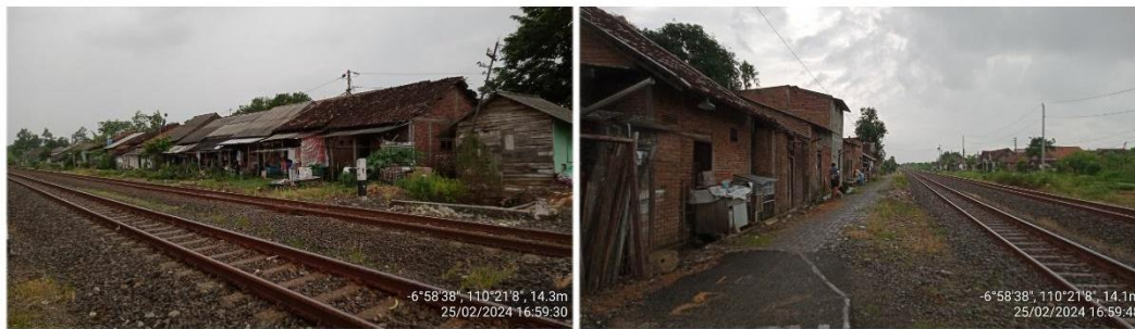
Gambar 3. Permukiman di Sempadan Rel Kereta Api RT 07/ RW 05 Kelurahan Tugurejo

“Kalau ditanya rumah-rumah yang ada di pinggir rel tentang kepemilikan tanah dan rumah pribadi atau bukan, kami juga bingung. Mereka membangun rumah dengan dana pribadi namun tanah tersebut milik PT KAI. Perumahan ini juga dulu milik KORPRI, maka dari itu sebagian besar penduduk RW 05 khususnya di RT 01, RT 02, RT 03, RT 04, dan RT 05 ini kebanyakan pensiun. Selain itu yaitu RT 6 dan RT 7 merupakan pendatang dan wilayah pemekaran di tahun 1998, orang yang belum mempunyai hunian dan yang masih menjadi satu dengan mertua, melihat ada lahan kosong langsung didirikan bangunan (Wahid, komunikasi pribadi, tanpa tanggal).”