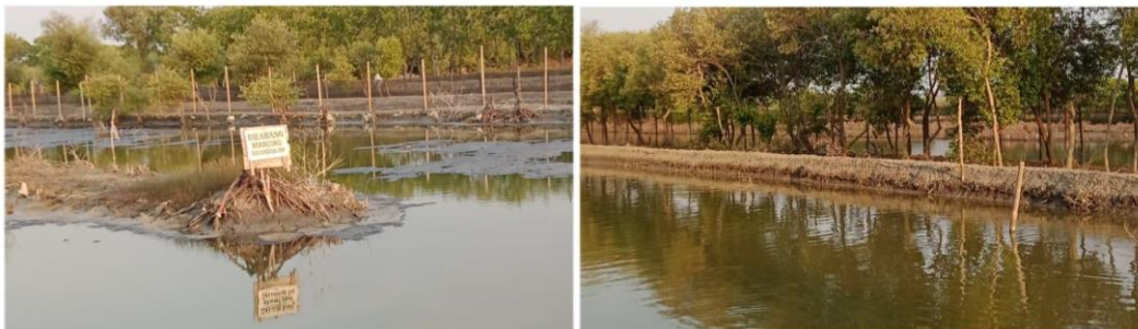
Gambar 2. Tambak di Kelurahan Tugurejo

Sumber daya alam dalam penilaian kapasitas masyarakat berdasarkan sumber daya penghidupan di RT06/ RW01 memiliki skor terendah dari keseluruhan sumber daya, yaitu 2,07 dari 5. Sumber daya alam yang dinilai meliputi kepemilikan lahan dan kepemilikan tambak (Gambar 2). Penilaian kuesioner yang dilakukan memberikan hasil terendah dalam indikator kepemilikan tambak dengan rata-rata skor 1,06 yang termasuk dalam kapasitas kelas rendah. Hal tersebut dikarenakan walaupun berbatasan dengan pesisir secara langsung dan tutupan lahan hanya 4,5% dari total keseluruhan masyarakat yang bekerja sebagai petani tambak. Masyarakat yang bekerja sebagai petani tambak pun melakukan aktivitas menambak dengan sistem sewa. Menurut penuturan masyarakat yang bekerja sebagai petani tambak, kepemilikan tambak yang disewakan berasal dari masyarakat RT 01/RW 01.