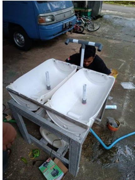
Gambar 2. Rangkaian Alat Hidroponik

Dalam perakitan hidroponik ini, drum bekas untuk media tanam berukuran 75 cm dipotong menjadi dua bagian secara vertikal diletakkan pada bagian atas kerangka hidroponik. Sedangkan drum bekas untuk menampung air berukuran 75 cm berada di bagian bawah kerangka hidroponik. Selanjutnya, pipa dipotong menyerupai Gambar 1. Terdapat 2 jenis pipa yaitu pipa untuk membawa air dari kolam ke media tanam dan pipa untuk mengalirkan air dari media tanam kembali ke kolam. Rangkaian alat hidroponik dapat dilihat pada Gambar 2.