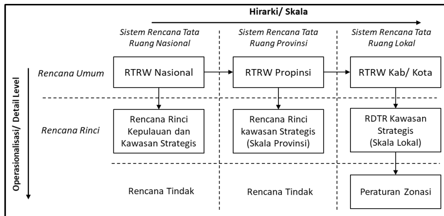
Gambar 1. Sistem perencanaan tata ruang di Indonesia berdasarkan UUPR No.26 tahun 2007 [31].