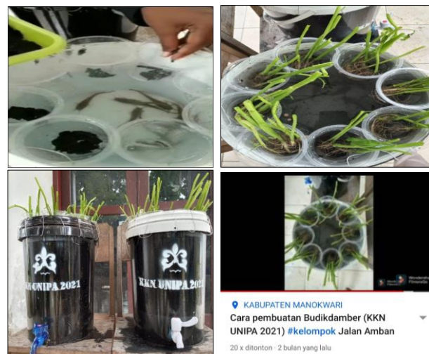
Gambar 2. Pembuatan Video Budikdamber.

Budikdamber merupakan teknik pengembangan dari aquaponik, dimana ikan dan tanaman tumbuh dalam satu tempat. Ikan yang digunakan di sini adalah benih ikan lele dengan media ember (Gambar 2). Cara pembuatannya sebagai berikut: (1) membuat lubang di bagian bawah samping untuk saluran pembuangan. Bisa juga membuat kran air untuk mempermudah pembuangan; (2) mengisi ember dengan air. Namun air yang diisikan jangan terlalu penuh, tujuannya agar ikan lele bisa mengambil udara dengan baik; (3) Masukkan benih ikan lele; (4) untuk benih kangkung bisa dimasukan bersama arang; (5) potong kawat sepanjang 12 cm dan buat kait untuk pegangan gelas dalam ember, setelah itu rangkai gelas pada ember (Gambar 2, Tabel 1).