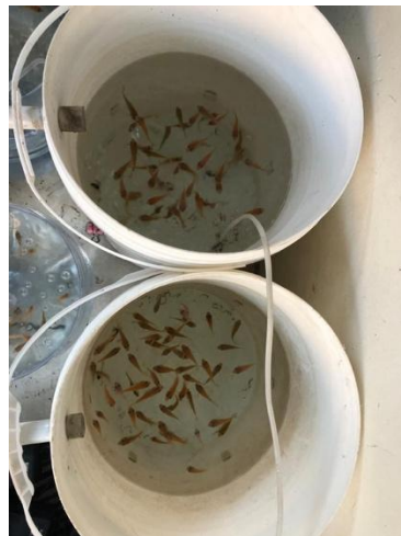
Gambar 2. Hasil Budidaya ikan Nila

Suhu yang tidak stabil menurut petani setempat menyebabkan proses pertumbuhan ikan nila menjadi lebih lambat. Akibatnya waktu yang dibutuhkan untuk mencapai masa panen memanjang hingga tujuh bulan yang mana lebih lama dibandingkan waktu normal yang biasanya berkisar antara empat hingga lima bulan. Permasalahan suhu air di kolam menunjukkan bahwa fluktuasi suhu memberikan dampak yang cukup signifikan terhadap proses budidaya ikan nila sehingga diperlukan langkah-langkah tertentu untuk menjaga suhu kolam tetap stabil atau mencari solusi lain guna menjaga pertumbuhan ikan nila agar tetap optimal.