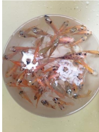
Gambar 1. Ikan Nila pada Ember

Pemijahan ikan nila ( Oreochromis niloticus ) dengan menggunakan teknologi monosex di Desa Kemuning telah menghasilkan bibit ikan jantan berkualitas tinggi. Teknologi monosex memanfaatkan hormon 17\alpha -metiltestosteron yang diberikan selama tahap larva untuk mengubah kelamin ikan menjadi Jantan (Yusuf et al., 2024). Ikan jantan memiliki keunggulan dibandingkan ikan betina dalam hal pertumbuhan yang lebih cepat, sehingga mempercepat waktu pemanenan dan meningkatkan efisiensi produksi.