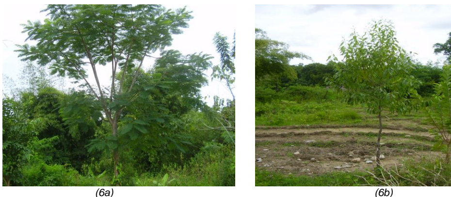
Gambar 6. Pertumbuhan Tanaman Pada Umur 3 Tahun, Flamboyan Mencapai Tinggi 6 M (6a) Dan Cendana 2,5 M (6b), Di Desa Sirani Haliwen – Belu.

Seperti halnya pertumbuhan tanaman di Desa Leosama, pertumbuhan tanaman penghijauan di Desa Sirani Haliwen – Belu cukup bagus (Tabel 2). Untuk tujuan ekowisata penanaman tanaman penghijauan dilakukan dengan berbagai pertimbangan, yakni: cendana memiliki ‘nilai histori’ dengan lingkungan dan masyarakat Nusa Tenggara Timur; tanaman flamboyan memiliki warna bunga yang indah dan mencolok; jambu biji merupakan tanaman buah yang ekonomis; mahoni merupakan tanaman pinggir jalan penghasil kayu bahan bangunan; dan nitas sebagai tanaman yang mulai langka.