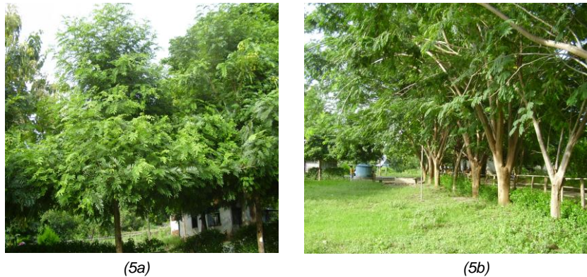
Gambar 5. Pertumbuhan Tanaman pada Umur 4 Tahun, Johar Mencapai Tinggi 6 M (5a) dan Sengon Buto 27 M (5b), Di Desa Leosama – Belu.

Johar dan jarak pagar merupakan jenis tanaman yang telah lama beradaptasi dengan lingkungan beriklim kering Timor, dibandingkan dengan gmelina dan sengon buto. Keempat jenis tanaman tersebut terbukti memiliki pertumbuhan (tinggi, lingkaran batang dan lebar tajuk) yang bagus (Tabel 1) sehingga dapat mendukung sebagai tanaman penghijauan di Kabupaten Belu.