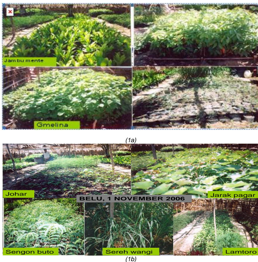
Gambar 1. Beberapa Jenis Tanaman Penghijauan Daerah Tangkapan Air 'Embung' dan Perkampungan Desa Leosama-Belu, Tahun 2006 (1a Dan 1b).

Pada tahun 2006-2008, di sekitar 'embung' Leosama (daerah tangkapan air dan perkampungan) dan sekitar perkampungan 'embung' Sirani, telah dilaksanakan revegetasi berbagai jenis tumbuhan (Gambar 3). Pada bulan April, tahun 2011, dilaksanakan evaluasi dengan cara mengunjungi lokasi penelitian, pengukuran pertumbuhan tanaman (tinggi, lingkaran batang dan lebar tajuk) dan wawancara dengan para petani serta tokoh masyarakat setempat. Di daerah tangkapan air embung Leosama, evaluasi juga dilakukan untuk membandingkan vegetasi di bawah tegakan pohon dan pada lahan yang terbuka tanpa naungan pohon.