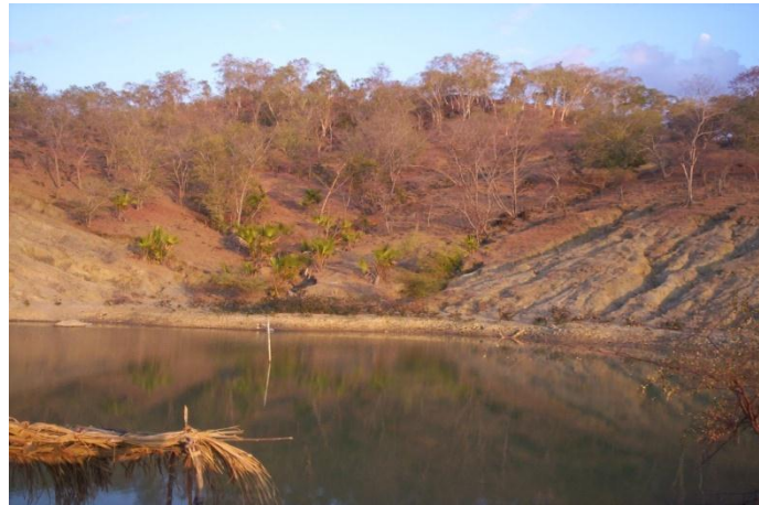
Gambar 1. Embung Leosama, Kabupaten Belu-NTT

panjang lereng 220 m dan kemiringan lereng 35%. Kondisi daerah tangkapan berupa lahan telantar dengan tutupan vegetasi yang rendah. Pengaruh faktor-faktor tersebut di atas, yakni: Curah hujan di Leosama sebesar 1040,5 mm/tahun berpotensi mengakibatkan erosivitas tinggi karena terjadi dalam periode pendek dan hanya oleh beberapa kejadian hujan. Dari analisis pendugaan erosi menggunakan metode USLE, diketahui nilai erosivitas hujan ( R ) = 797.22, erodibilitas tanah ( K ) = 0.88, panjang lereng ( L ) = 3.16 dan kemiringan lereng ( S ) = 87.79 penutup tanah dan manajemen tanaman ( CP ) = 0.5 yang diduga akan mengakibatkan erosi sebesar 97.383 ton/ha/tahun. Volume erosi sebesar 97.383 ton/ha/tahun, pada daerah tangkapan air seluas 5 ha dapat mengakibatkan pendangkalan embung Leosama sebesar 0,6 m per tahun. Erosi berat dari daerah tangkapan air tersebut mengakibatkan kedalaman air embung berkurang dari kedalaman maksimum 8 m pada tahun 1995/1995, dan hanya tinggal 2 m pada tahun 2005/2006 (Widiyono, 2008).