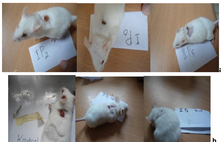
Gambar 2: Proses penutupan luka pada mencit pada hari ke 5 (a), dan hari ke 8 (b)

Gambar 2 menunjukkan bahwa pada luka mencit yang diolesi dengan gelatin P5 pada hari ke 5 sudah menunjukkan proses penutupan luka lebih cepat dibandingkan dengan yang diolesi gelatin P0 maupun P2. Pengamatan pada hari ke 8 penutupan luka dengan olesan gelatin P5 hampir menutup sempurna, sedangkan pada mencit kontrol yang tidak diolesi dengan gelatin belum menunjukkan proses penutupan luka. Berdasarkan penelitian menunjukkan bahwa gelatin yang diperoleh dari pencucian dengan air mengalir sebanyak 5 x berat bahan kulit kaki ayam (P5), merata waktu yang diperlukan untuk penutupan luka 10,25 hari. Waktu yang diperlukan untuk penutupan luka oleh gelatin P5 lebih cepat dibandingkan dengan perlakuan yang lain, tetapi tidak berbeda nyata dengan pencucian sebanyak 20 kali berat bahan kulit kaki ayam (P4).