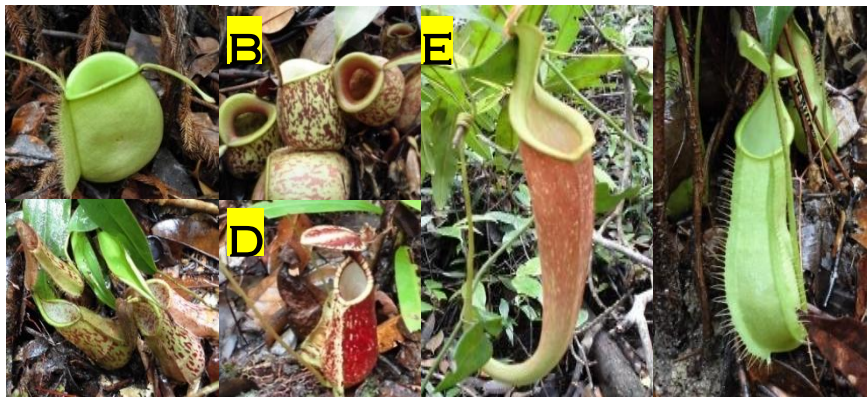
Gambar 1.a) N.ampularia hijau; b) N.ampularia semburat merah; c) N.mirabilis ; d) N.rafflesiana (kantong bawah); e) N.rafflesiana (kantong atas); dan f) N.hirsuta .

I dikatakan kemerataan dalam keadaan agak seimbang dikarenakan keempat jenis Nepenthes dapat ditemukan pada lokasi ini. Hal ini disebabkan oleh kondisi iklim mikro pada stasiun I lebih sesuai untuk pertumbuhan Nepenthes spp. daripada ketiga stasiun pengamatan lainnya.