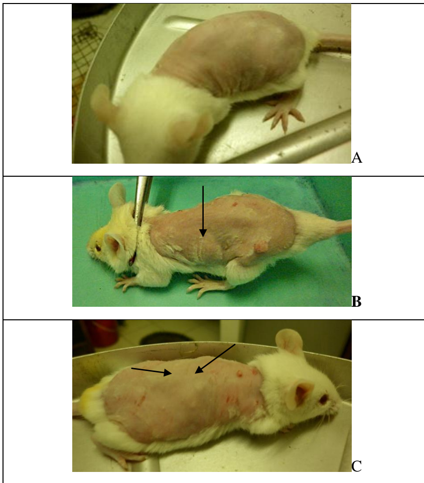
Gambar 1. A. Mencit dengan kulit normal, tampak mulus, mengkilat, dan elastis. B & C. Mencit setelah 20 minggu terpapar UV, kulit tampak pucat, berkerut, dan kasar, muncul nodul tumor (tanda panah).

Pada dosis perlakuan tertinggi ini, jumlah hewan uji yang tumor juga paling sedikit dengan angka insidensi 20% (Gambar 2)