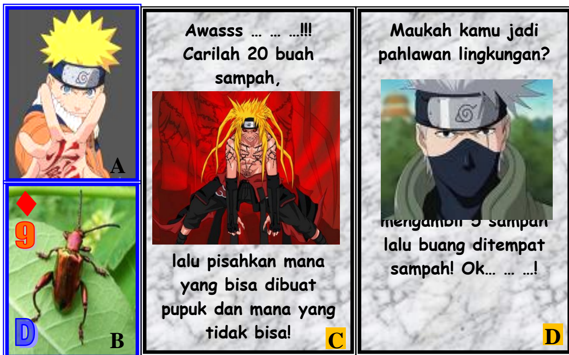
Gambar 3. Desain kartu permainan: (A) Desain kartu Brigde. Halaman depan, (B). Halaman belakang kartu. Diberi label atau tanda kode soal. Di gambar tertulis kode D. Berarti siswa yang ingin menang tanpa mengadu nilai kartu yang dimiliki dengan nilai kartu lawan harus menjawab soal dengan kode D. (C) dan (D) Disain kartu hukuman