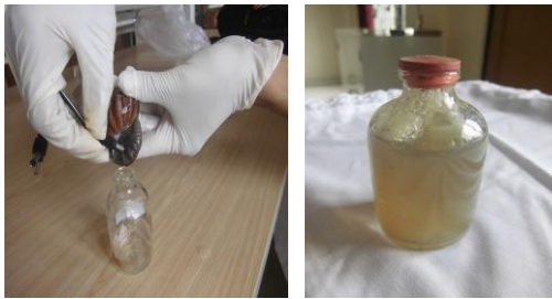
Gambar 2. Isolasi lendir bekicot