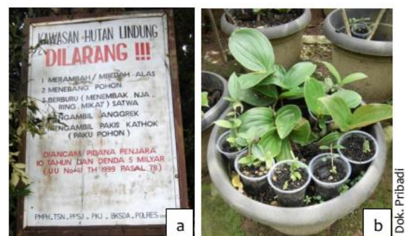
Gambar 2. Upaya Konservasi (a) Larangan Pengambilan Satwa dan Tumbuhan Langka dan (b) Upaya Pembibitan Parijoto Untuk Realisasi Rencana Desa Parijoto

Kepercayaan terhadap mitos juga turut berperan dalam menjaga kelestarian keanekaragaman hayati Muria yaitu kepercayaan terhadap parijoto dan pakis kathok yang memiliki khasiat mujarab. Pernyataan tersebut didukung Widjanarko (2008) dan Wibowo (2012) bahwa masyarakat Muria memiliki pola memanfaatkan alam seperlunya dan beberapa upacara sebagai wujud syukur. Salah satu upacara adalah sedekah bumi sebagai perwujudan rasa syukur kepada Allah atas hasil alam yang berlimpah dan sebagai wadah untuk berbagi dengan sesama. Kearifan lokal masyarakat Muria menganut pola etika ekosentris yang diterapkan dengan menjaga kelestarian lingkungan dan keanekaragaman hayati khas lereng Pegunungan Muria.