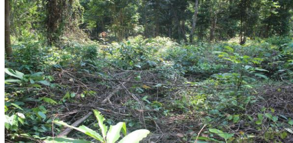
Gambar 2. Aktivitas mancah