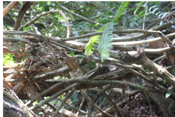
Gambar 3. Aktivitas matiko ukor