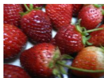
Gambar 1. Buah stroberi

Tanaman stroberi merupakan salah satu tanaman buah-buahan yang mempunyai nilai ekonomi tinggi. Daya pikatnya terletak pada warna buah merah mencolok dengan bentuk yang mungil, menarik serta rasa manis yang segar. Buah stroberi berkhasiat bagus untuk kesehatan tubuh. Menurut USDA (Unitet State Departemen Agriculture), stroberi dapat mencegah kanker payudara dan leher rahim. Stroberi memiliki aktivitas antioksidan tinggi karena mengandung quercetin, ellagic acid, antosianin dan kaemferol. Antioksidan berperan sebagai pelindung tubuh radikal bebas, termasuk diantaranya kanker. Zat tersebut mencegah terbentuknya senyawa karsinogen, menghambat proses karsinogenesis, dan menekan pertumbuhan tumor. Fungsi antioksidan didukung oleh kandungan vitamin C yang tinggi yaitu sekitar 56,7 mg per 100 g