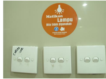
Foto-foto sebagai representasi “mewujudkan Green Hospital di Rumah Sakit Persahabatan.

1 Sekretariat PROPER, Kementerian Lingkungan Hidup. Laporan Hasil Penilaian PROPER 2011. Program Penilaian Peringkat Kinerja Perusahaan dalam Pengelolaan Lingkungan Hidup.2011