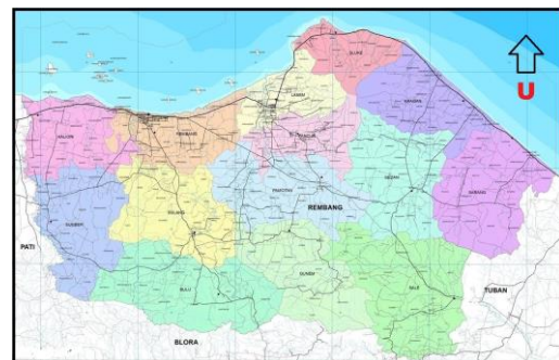
Gambar 2. Peta Kabupaten Rembang

Berdasarkan data Pemerintah Daerah Kabupaten Rembang, luas wilayah Kabupaten Rembang 101.408 Ha dengan panjang jalan milik Kabupaten sebesar 629,1 km atau 629.100 m.