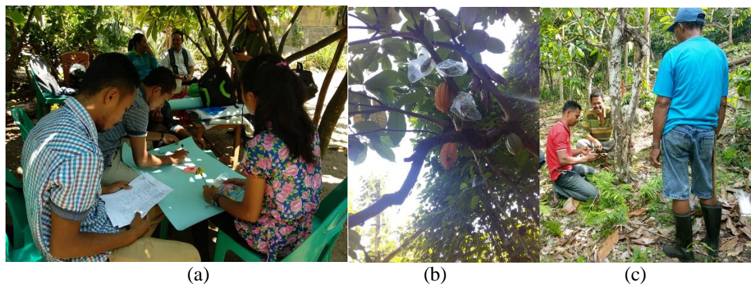
Gambar 2. Kegiatan analisis ekosistem (a), pemasangan sarungnisasi (b), Sambung samping (c)

Kendala yang dihadapi tim pada saat melakukan kegiatan pre-test dan post-test ini adalah 45% anggota kelompok tidak dapat membaca dan menulis sehingga anggota tim turut serta dalam menjelaskan isi dari pertanyaan yang diajukan.