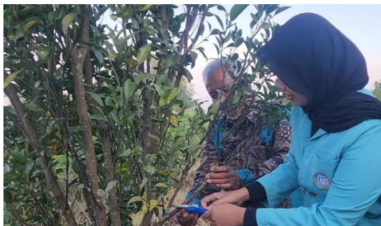
Gambar 3. Tim pengabdian bersama petani juga melakukan praktik langsung

Sebagai tindak lanjut kegiatan, dilakukan survei terhadap peserta untuk menilai peningkatan pemahaman dan tingkat kepuasan setelah mengikuti program introduksi jeruk Malang (Gambar 4). Sebagian besar peserta menyatakan puas terhadap pelaksanaan kegiatan.