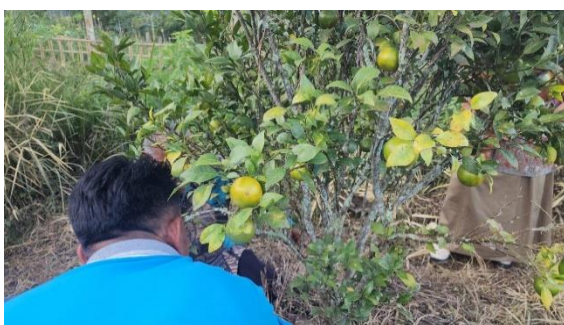
Gambar 1. Tanaman jeruk Malang yang tumbuh di Desa Setren

Pengenalan tiga varietas jeruk unggulan yang dinilai paling adaptif untuk kondisi agroklimat Desa Setren. Tiga varietas tersebut adalah Jeruk Siam Madu, Jeruk Baby Pacitan, dan Jeruk Keprok Batu 55. Jeruk Siam Madu memiliki keunggulan rasa sangat manis, namun memerlukan perawatan intensif untuk menjaga kualitas rasa tersebut ( Heru, 2023 ), Jeruk Baby Pacitan dikenal karena rasanya yang manis segar tanpa asam kuat sehingga cocok untuk bayi, dan memiliki daya adaptasi tinggi di berbagai ketinggian. Namun, varietas yang paling direkomendasikan untuk Desa Setren adalah Jeruk Keprok Batu 55. Varietas ini ideal dibudidayakan pada ketinggian 700–1.200 mdpl, sangat sesuai dengan kondisi Desa Setren ( Gambar 1 ), dan dikenal memiliki kualitas buah yang sangat baik serta produktivitas stabil ( Mustikajati, 2024 ).