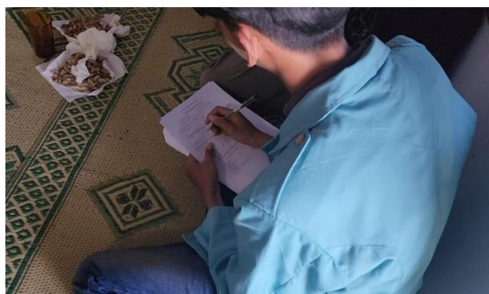
Gambar 4. Pelaksanaan wawancara dan survei kepuasan dengan kuisioner

Sebagai tindak lanjut kegiatan, dilakukan survei terhadap peserta untuk menilai peningkatan pemahaman dan tingkat kepuasan setelah mengikuti program introduksi jeruk Malang (Gambar 4). Sebagian besar peserta menyatakan puas terhadap pelaksanaan kegiatan.