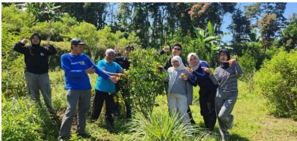
Gambar 6. Agrowisata “Petik Jeruk”