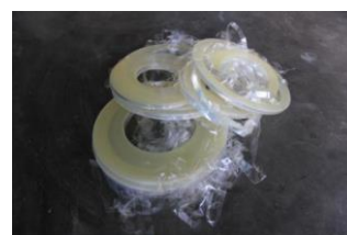
Gambar 1. Limbah plastik OPP laminasi dari industri percetakan