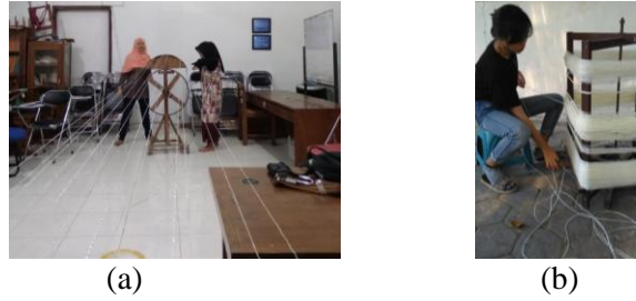
Gambar 3. Proses pemintalan menjadi tali (a) Proses penarikan dan plintiran, (b) Proses Pemintalan sekaligus penggulangan

Setelah bahan baku siap sesuai kebutuhan maka mulailah dilakukan proses selanjutnya. Bahan baku yang berupa tali tersebut bisa di kreasikan dalam teknik tekstil makrame, rajut , anyam bahkan tenun sesuai dengan kebutuhan rancangan produk kerajinan aksesoris fesyen . Keuntungan pengolahan limbah plastik OPP Laminasi ini melalui dua pilihan pengolahan diatas menjadikan limbah plastik sebagai bahan baku kerajinan aksesoris fesyen adalah dapat memberi solusi pengurangan timbunan sampah percetakan. Kombinasi teknik melalui teknik tekstil ini , dapat menjadi suatu instrumen yang penting dalam pengelolaan dan pengolahan sampah plastik OPP sebagai bahan baku produk kerajinan aksesoris fesyen. Visual dan tekstur dari proses pengolahan yang dihasilkan melalui teknik tekstil mampu menghasilkan estetika tersendiri yang unik dan khas, sehingga dapat diaplikasikan dalam berbagai keperluan produk kerajinan aksesoris fesyen.