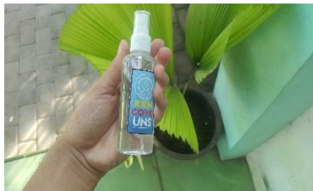
Gambar 5. Hasil pembuatan hansanitizer mandiri

Hand sanitizer berbasis alkohol dengan minimal 60% dipercaya lebih efektif untuk membunuh kuman dan mikroorganisme berbahaya di tangan, termasuk pencegahan virus Corona. Cara pembuatannya sangat mudah yakni dengan mencampurkan alkohol, cairan lidah buaya dan pewangi. Fungsi dari cairan lidah buaya ini adalah untuk sedikit menggumpalkan cairan, jadi handsanitizer tidak terlalu encer, pewangi disini untuk memberikan aroma segar pada hand sanitizer .