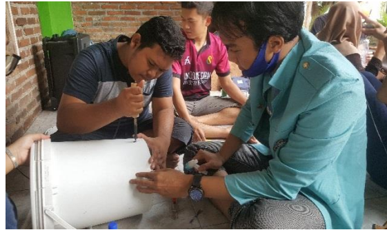
Gambar 6. Proses pembuatan tempat cuci tangan

Perserikatan Bangsa-Bangsa (PBB) membuat sebuah kampanye global untuk menyatakan setiap tanggal 15 Oktober adalah Hari Cuci Tangan Pakai Sabun Sedunia (HCTPS). Begitu banyak penyakit yang dapat ditularkan seperti penyakit saluran pernapasan, diare, infeksi cacing dan penyakit kulit. Dengan hanya mencuci tangan, tingkat infeksi saluran pernapasan dapat menurun hingga 16-25%.