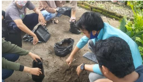
Gambar 2. Penaman sayur dengan media polybag

Guna menjaga ketahanan pangan di Indonesia maka kita bisa dilakukan kegiatan seperti menanam sayuran dan buah-buahan segar di Rumah. Sayur adalah sumber makanan yang memiliki gizi lengkap dan sehat. Sayur yang memiliki warna hijau merupakan sumber karoten (provitamin A). [7]. Salah satu program kerja KKN UNS yang dilakukan di Desa Pandantoyo Kec. Kertosono yakni melakukan penanaman Sayur Organik di rumah masing- masing.