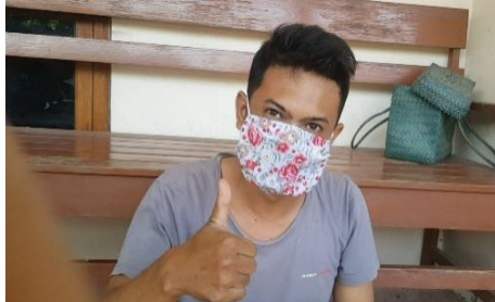
Gambar 4. Hasil pembuatan masker kain

Memakai masker dianggap sebagai cara efektif untuk meminimalisir risiko penularan Covid-19, semua orang yang beraktivitas di luar ruangan disarankan untuk mengenyakannya. Masker kain juga dapat mencegah kita dari kebiasaan menyentuh wajah dan menjadi pengingat visual untuk mempraktikkan phisycal distancing.