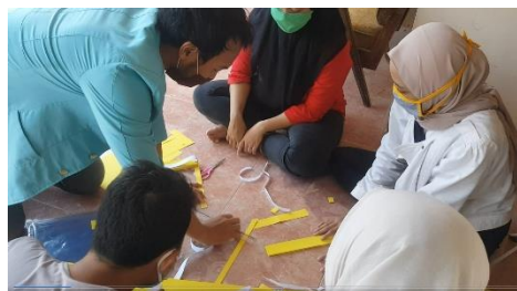
Gambar 3. Proses pembuatan face shield

Faceshield merupakan alat yang digunakan sebagai pelindung wajah (mata, hidung dan mulut) dari paparan percikan droplet atau tangan yang terkontaminasi bakteri atau virus.