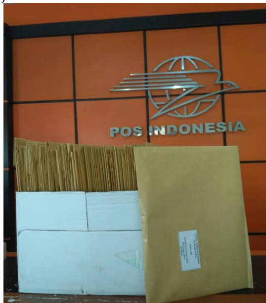
Gambar 3. Pengiriman Jurnal

yang akan dikirimkan jurnal terlebih dahulu didiskusikan dalam kegiatan rapat penentuan instansi pengiriman jurnal.