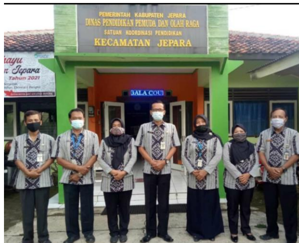
Gambar 1. Profil Mitra

Untuk meningkatkan tingkat perekonomian di Indonesia, industri pasar modal Indonesia mengembangkan pasar modal dengan prinsip-prinsip syariah islam sebagai alternatif instrumen investasi dalam kegiatan pasar modal di Indonesia. Pasar modal syariah dikembangkan dengan tujuan untuk pemenuhan kebutuhan umat muslim yang ada di Indonesia dan yang tertarik melakukan investasi pada produk-produk pasar modal yang sesuai dengan prinsip syariah.