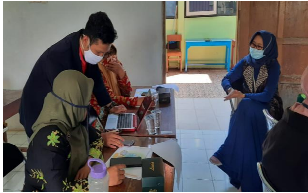
Gambar 4. Praktek Open Account Pasar Modal Syariah