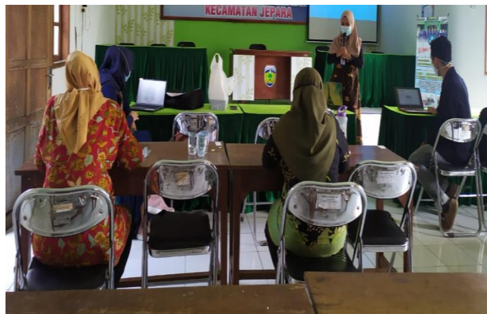
Gambar 3. Pemaparan Materi oleh Narasumber