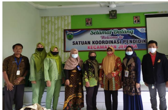
Gambar 5. Pendampigan Pasar Modal Syariah pada ASN di Lingkungan Satkordikcam Jepara

Tahap ini merupakan tahap akhir dari pendampigan Investasi Saham Syariah Pada ASN Di Lingkungan Satkordikcam Jepara, setelah mengikuti pelatihan bagaimana cara open account sekolah pasar modal syariah pada MNC Sekuritas diharapkan ASN mampu menerapkan bagaimana mengelola saham syariah. Tahap evaluasi dapat dilakukan oleh teman sejawat peserta pelatihan. Kegiatan evaluasi ini dilakukan oleh teman sejawat berupa kegiatan saling menilai dan memberi saran serta masukan. Berikut ini gambar terkait dengan pelatihan yang telah diselenggarakan pada ASN di lingkungan Satkordikcam Jepara.