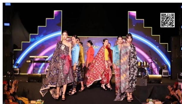
Gambar 9. Peragaan Kain Batik dalam Kegiatan Candiloka 2025

Kedua, hasil karya lokakarya membatik diperagakan juga dalam kegiatan Candiloka 2025. Festival budaya ini digelar guna merayakan kekayaan seni dan tradisi Nusantara dengan tema Selaras. Kegiatan yang diselenggarakan di Candi Banyunibo ini diselenggarakan sebagai wujud selarasnya warisan budaya, yaitu objek pemajuan kebudayaan dan cagar budaya. Harapannya agar kain batik bermotif Candi Merak dan Candi Sojiwan dapat semakin dikenal luas oleh masyarakat yang dapat terlihat pada Gambar 9.