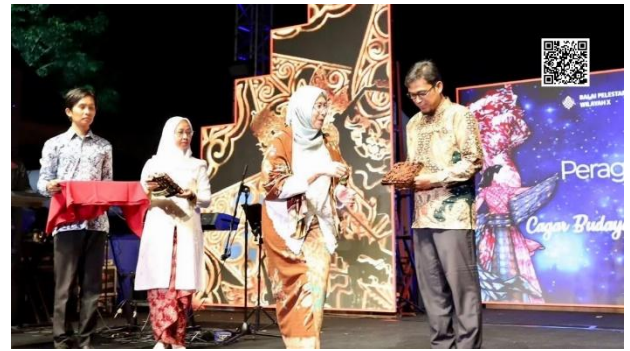
Gambar 7. Penyerahan Canting Batik Cap kepada Kepala Desa Karangnongko dan Desa Kebondalem Kidul