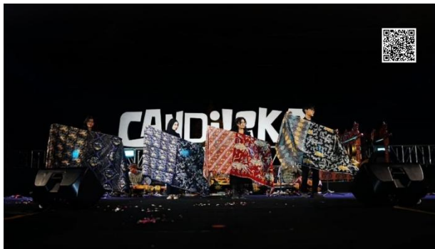
Gambar 8. Peragaan Busana Cagar Budaya dalam Goresan Malam

Kedua, hasil karya lokakarya membatik diperagakan juga dalam kegiatan Candiloka 2025. Festival budaya ini digelar guna merayakan kekayaan seni dan tradisi Nusantara dengan tema Selaras. Kegiatan yang diselenggarakan di Candi Banyunibo ini diselenggarakan sebagai wujud selarasnya warisan budaya, yaitu objek pemajuan kebudayaan dan cagar budaya. Harapannya agar kain batik bermotif Candi Merak dan Candi Sojiwan dapat semakin dikenal luas oleh masyarakat yang dapat terlihat pada Gambar 9.