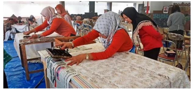
Gambar 4. Pelatihan Teknik Membatik Cap

Kedua teknik membatik ini, baik tulis maupun cap, memiliki karakter desain motif batik yang berbeda. Batik tulis cenderung berkarakter motif detail dan kompleks. Sebaliknya, motif batik cap cenderung lebih geometris atau terdapat pengulangan motif. Peserta lokakarya membatik dengan media kain katun berukuran 250 cm x 105 cm, setengah bagian dengan teknik batik tulis dan setengah bagian dengan teknik batik cap.