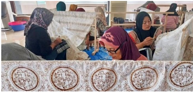
Gambar 3. Pelatihan Teknik Membatik Tulis