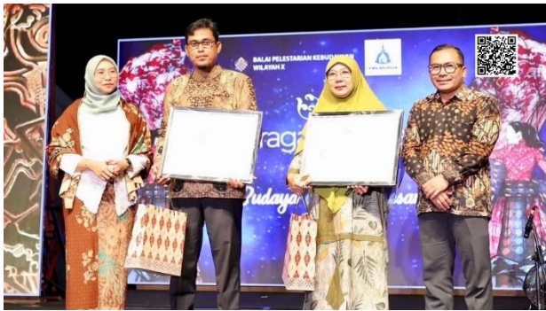
Gambar 6. Penyerahan Desain Master Batik kepada Kepala Desa Karangnongko dan Desa Kebondalem Kidul

UMKM batik, aneka kerajinan, dan kuliner lokal. Harapan utamanya, masyarakat dapat mengenal dan mengetahui keberadaan karya batik bermotif Candi Merak dan Candi Sojiwan, sehingga dapat turut terlibat dalam pengembangan ke depan.