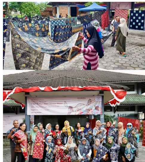
Gambar 5. Hasil Karya Lokakarya Membatik