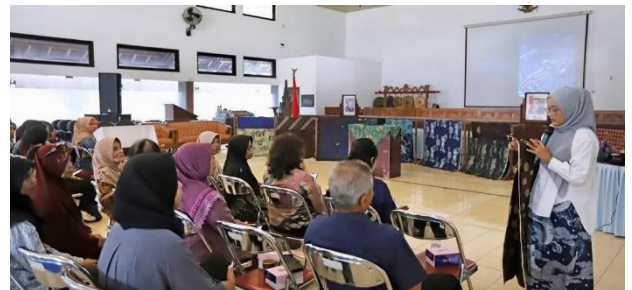
Gambar 2. Penyampaian Materi Culturepreneurship

Peserta lokakarya membatik tampak antusias dalam sesi ini, ditandai dengan aktif bertanya dan menyampaikan gagasannya. Harapannya, proses pemahaman materi dapat terserap dengan baik dan maksimal. Secara keseluruhan, tahap ini bertujuan membangun cultural awareness (kesadaran kultural) dan pemahaman konseptual peserta.