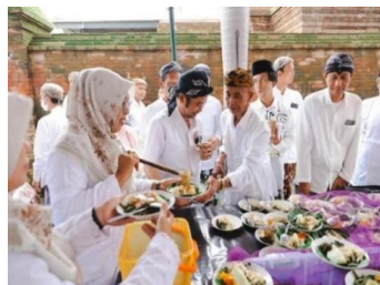
Gambar 10. Gotong Royong Warga Kudus Kulon

Wawancara dengan pedagang menunjukkan adanya keterikatan emosional dan kesadaran untuk turut “nguri-nguri” 1 tradisi Sunan Kudus. Melalui peredaran simbol religius dalam praktik ekonomi, pedagang atribut keagamaan berkontribusi dalam mempertemukan nilai sakral dan profan secara material, visual, dan afektif. Aktor pendukung merupakan aktor yang menopang keberlangsungan Atmosfir ruang melalui praktik yang konsisten dan berulang, tanpa mendominasi panggung (Maria Ulfa, 2025). Dalam hal ini, aktor pendukung yakni warga Kudus Kulon, pedagang umum dan panitia, serta pengunjung.