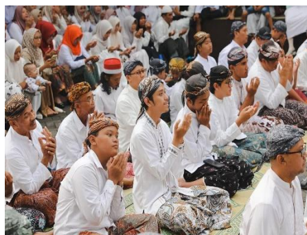
Gambar 4. Konstruksi Tubuh Sosial menjadi Tubuh Religius

Relasi tubuh dan ruang selanjutnya mempengaruhi konstruksi tubuh aktor. Dalam ruang performatif, tubuh tidak sekadar merepresentasikan peran sosial, tetapi menjadi arena transformasi pengalaman fisik dan emosional (Fischer-Lichte, 2006). Perubahan kecil dalam posisi tubuh di ruang mengubah konteks dan makna, dan tubuh menjadi konten utama yang memproduksi pengalaman emosional dan perseptual penonton (Maeshiba, 2024). Dalam konteks ini, ruang Menara mengonstruksi tubuh sosial menjadi tubuh religius yang terikat oleh tata krama, hierarki, dan ritus kolektif. Hal ini tampak dalam gestur doa pada gambar 4, sikap tubuh yang tunduk, suara " amin " yang lirih, serta keseragaman kostum yang menegaskan kepatuhan terhadap nilai sakral. Sebaliknya, Pasar Malam sebagai ruang kapital mengonstruksi tubuh sosial menjadi tubuh kapital yang bebas, dinamis, dan atraktif seperti yang tampak pada gambar 5. Tubuh pedagang dan pelaku wahana diproduksi secara performatif melalui gestur, kostum, dan atraksi yang menjadikan tubuh sebagai medium hiburan dan nilai tukar.