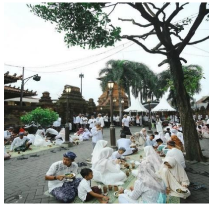
Gambar 9. Perluasan Ruang Sakral ke Ruang Publik