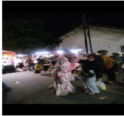
Gambar 5. Konstruksi Tubuh Sosial Menjadi Tubuh Kapital

Meskipun demikian, namun pada wilayah perbatasan kedua ruang, tubuh pengunjung harus menegosiasikan dua logika ruang yang berbeda secara bergantian. Tubuh menjadi arena transisi simbolik antara sikap tertib sakral dan ekspresi bebas profan, menunjukkan bahwa relasi tubuh dan ruang bersifat cair dan situasional (Avoine, 2024).