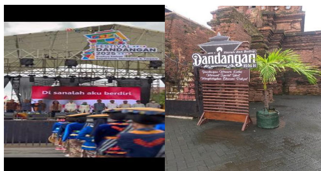
Gambar 3. Tema-tema Acara (dokumentasi pribadi, 2025)

Unsur fisik berikutnya adalah Bangunan temporer yang didirikan hanya saat perayaan tradisi Dandhangan diselenggarakan. Bangunan ini terbagi menjadi tiga bagian, yakni pertama tenda bazar yang digunakan untuk jual-beli makanan/fashion, kerajinan tangan, dan sebagainya. Sebagai metode menarik pembeli, beberapa penjual melakukan atraksi keahlian dengan menggunakan barang dagangannya sebagai objek, dan beberapa lainnya menggunakan musik dari media elektronik untuk menarik perhatian pembeli. Kedua wahana permainan seperti komedi putar, ombak banyu, kora-kora yang dihiasi lampu warna-warni. Ketiga panggung rigging di alun-alun Kulon sebagai spot menggelar seni pertunjukan. Dalam panggung pertunjukan, berbagai kegiatan dilangsungkan seperti pembukaan tradisi Dandhangan , seni religius (gambus, rebana), seni tradisi (keroncong, barongan), teater kontemporer, dan tari kreasi lokal (gebyog ukir, kretek). Unsur-unsur fisik tersebut menunjukkan nuansa dan suasana yang cenderung ke arah hiburan.