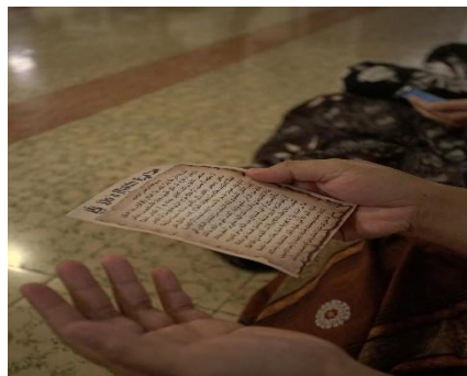
Gambar 6. Teks Doa sebagai Media Ekspresi di Ruang Menara (Dokumentasi @officialmedia_menarakudus)

Konstruksi tubuh tersebut dapat tercipta karena pengaruh dari perbedaan media ekspresi yang ada di dua ruang tersebut. Di ruang Menara, teks doa yang ditunjukkan oleh gambar 6 berfungsi sebagai media ekspresi utama yang mengunci gestur tubuh dan menjaga atmosfer religius. Konstruksi teks dan image membentuk “imagologi agama” yang mengatur cara tubuh dan ekspresi keagamaan dipraktikkan di ruang (Fakhruroji et al, 2020). Pembacaan doa dan ritual kolektif mengarahkan tubuh pada sikap khushyuk dan sinkron. Sebaliknya, di Pasar Malam, media ekspresi gembira dimediasi oleh teknologi digital, khususnya ponsel, yang memungkinkan tubuh mengekspresikan kegembiraan secara terbuka dan membagikannya melalui media sosial (Tsuria, 2021) seperti yang tampak pada gambar 7. Perbedaan media ekspresi ini menegaskan perbedaan orientasi nilai antara ruang sakral dan ruang profan dalam tradisi Dandhangan .