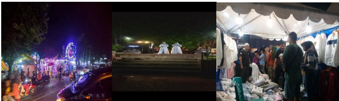
Gambar 2. Bangunan Temporer

Unsur fisik berikutnya adalah Bangunan temporer yang didirikan hanya saat perayaan tradisi Dandhangan diselenggarakan. Bangunan ini terbagi menjadi tiga bagian, yakni pertama tenda bazar yang digunakan untuk jual-beli makanan/fashion, kerajinan tangan, dan sebagainya. Sebagai metode menarik pembeli, beberapa penjual melakukan atraksi keahlian dengan menggunakan barang dagangannya sebagai objek, dan beberapa lainnya menggunakan musik dari media elektronik untuk menarik perhatian pembeli. Kedua wahana permainan seperti komedi putar, ombak banyu, kora-kora yang dihiasi lampu warna-warni. Ketiga panggung rigging di alun-alun Kulon sebagai spot menggelar seni pertunjukan. Dalam panggung pertunjukan, berbagai kegiatan dilangsungkan seperti pembukaan tradisi Dandhangan , seni religius (gambus, rebana), seni tradisi (keroncong, barongan), teater kontemporer, dan tari kreasi lokal (gebyog ukir, kretek). Unsur-unsur fisik tersebut menunjukkan nuansa dan suasana yang cenderung ke arah hiburan.