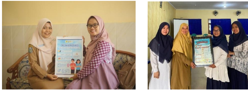
Gambar 4. Pemberian Media Edukasi Kesehatan Seksual