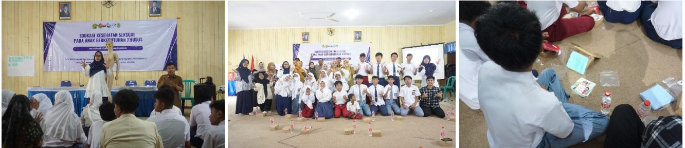
Gambar 2. Kegiatan Edukasi

disampaikan dengan menggunakan materi power point dan alat peraga berupa phantom. Selama kegiatan, pemateri didampingi dengan guru yang memiliki kemampuan Bahasa Isyarat Indonesia (bisindo) untuk mempermudah siswa memahami materi yang disampaikan. Setelah proses pemberian materi, puzzle diberikan untuk memperjelas pemahaman siswa terhadap materi yang telah disampaikan. Permainan puzzle dilakukan selama 20 menit oleh masing-masing siswa, sampai dapat menyusun puzzle dengan benar. Beberapa guru juga turut serta mendampingi dalam proses penyusunan puzzle dan memfasilitasi siswa yang kesulitan dalam menyusun permainan tersebut.