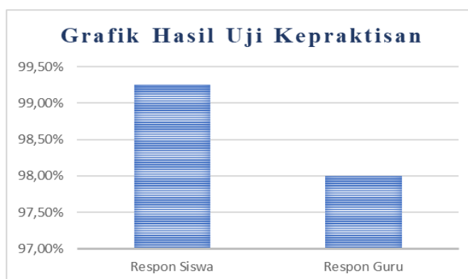
Gambar 2. Hasil Uji Kepraktisan

Kepraktisan e-book anti korupsi dinilai menggunakan angket respon guru dan siswa. Isi angket respon guru dan siswa ini memiliki 10 butir pernyataan dengan 10 indikator penilaian, yaitu menarik, menyenangkan, penugasan P5 jelas, tulisan jelas, mudah dibaca, materi mudah dipelajari. Adapun angket respon guru didapatkan hasil persentase yakni 98% kategori Sangat Praktis. Sedangkan angket respon siswa yang diisi oleh sebanyak 24 siswa didapatkan jumlah nilai 1.191 dengan persentase yakni 99,25% kategori Sangat Praktis. Kedua angket menghasilkan persentase dengan kategori Sangat Praktis, dengan begitu buku pendamping praktis digunakan dalam pembelajaran. Hasil persentase angket bisa dilihat pada grafik berikut: