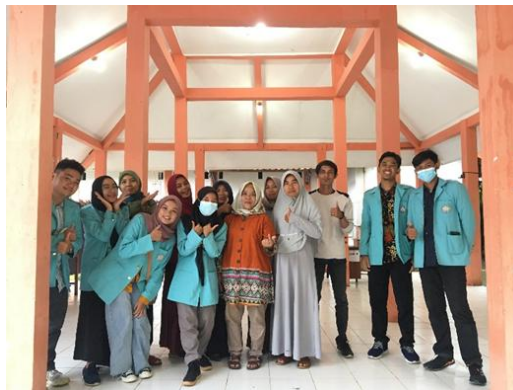
Gambar 3. Foto bersama antara peserta dan tim KKN UNS kelompok 93