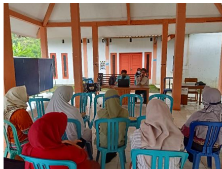
Gambar 1. Pelaksanaan demonstrasi pembuatan desain kemasan produk dan sosial media

Kegiatan pengabdian kepada masyarakat ini berjalan dengan lancar meskipun ada sedikit kendala teknis saat akan mendemonstrasikan proses pembuatan desain kemasan produk. Kegiatan ini diterima dengan sangat baik dan antusias oleh partisipan yang merupakan ibu-ibu pengurus rumah produksi UMKM Giriberkah Desa Giritirto.