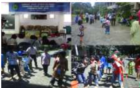
Gambar 3: Suasana Outbond

seperti musuh bebuyutan bagi adik-adik jalanan. Di-harapkan adik-adik jalanan mempunyai persepsi bahwa sebenarnya polisi adalah pelindung mereka, bahwa polisi adalah sahabat mereka yang siap membantu ketika dalam kesulitan. Karena di dalam konteks anak jalanan, motto tersebut diragukan kebenarannya, bahkan berbanding berbalik.”