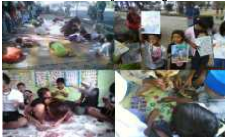
Gambar 5: Berkerajinan Tangan Bersama