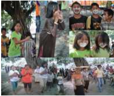
Gambar 4: Suasana Lomba