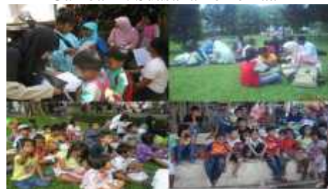
Gambar 2: Suasana Pembinaan

Anak jalanan, sama seperti anak-anak pada umumnya yang membutuhkan pendidikan untuk bekal masa depan. Oleh dari itu, untuk pembinaan anak jalanan, ada beberapa LSM yang dengan suka rela menampung anjal untuk belajar menulis, membaca, mengaji dan banyak kegiatan lainnya. Salah satu LSM yang memfasilitasi pendidikan bagi anak jalanan adalah Griya Baca. Griya Baca merupakan wadah bagi anjal yang diurus oleh para mahasiswa dari berbagai universitas di Kota Malang. Kegiatan pembinaan dilakukan pada sore hari setiap hari Selasa dan Sabtu.