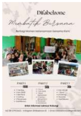
Gambar 1. Price List Paket Membatik

“Biasanya kalau komunitas itu akan mengambil paket yang ketiga, karena kan yang ikut banyak dan itu jadi kenang-kenangan. Tapi kalau yang berkunjung itu individu biasanya mengambil paket yang paling mahal. Jadi dapat mercedesnya lebih besar ukurannya dan lebih banyak. Tergantung yang di mau apa.” (Wawancara dengan informan YN, 13 oktober 2024)