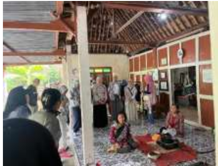
Gambar 2. Sambutan Kedatangan Dan Perkenalan

“Biasanya dijelaskan terlebih dahulu bagaimana caranya membuat, mulai dari menggambar, terus cara mencantingnya, dijelaskan juga alat-alatnya seperti canting, malam, ukuran kain, motifnya juga. Kalau disini motifnya bebas karena kan kombinasi.” (Wawancara dengan informan RH, 13 Oktober 2024)