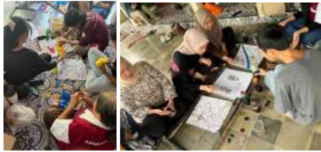
Gambar 5. Tahap Mewarnai