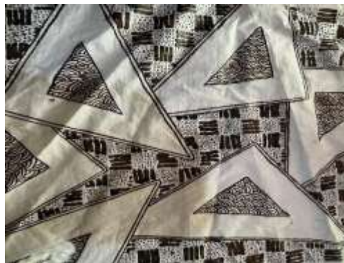
Gambar 8. Motif kombinasi dari Informan IK, AN dan YN