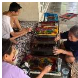
Gambar 6. Tahap Memberi Penguat Warna

Proses memberi penguat warna bertujuan agar kain yang telah di canting dan diberi warna ketika direbus tidak luntur warnanya. Penguat warna dioleskan secara merata keseluruh kain setelah itu dijemur.