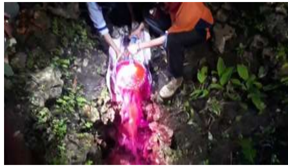
Gambar 3. Tracing di Ponor Banjiran dan Watu Belah

Selain itu, mereka turut mendukung kemenangan Bapak Samtilar sebagai Kepala Desa Sikayu untuk periode 2019-2025.