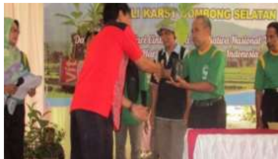
Gambar 1. Gerakan Penanaman Pohon oleh PERPAG

pegunungan karst Gombang Selatan, tepatnya di sekitar Gua Banteng dan Gua Cocor, yang terletak di Hulu Pedukuhan Karangkamal, Desa Sikayu, Buayan pada tahun 2015. Tahun 2016, PERPAG juga melaksanakan aksi penghijauan dengan menanam 33.000 bibit pohon jati, akasia, dan mahoni di lahan PT. Semen Gombang, melibatkan sekitar 1.500 orang dari berbagai kalangan, termasuk masyarakat setempat serta pelajar dari berbagai tingkat pendidikan, di empat desa: Banyu Mundal, Nogoraji, Sikayu, dan Karang Sari, dengan total area sekitar 32 hektar.