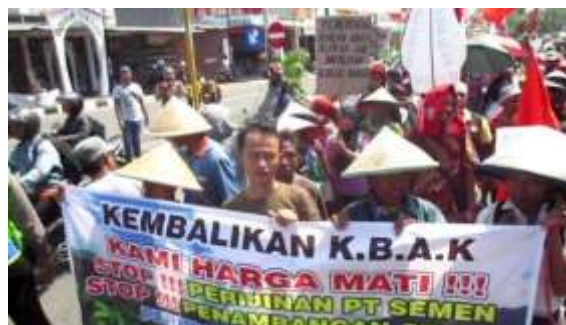
Gambar 2. Aksi Massa Menuntut Pencabutan IUP PT. Semen Gombang di Kantor Kabupaten Kebumen

Selain itu, mereka berhasil menggagalkan pengesahan AMDAL PT. Semen Gombang pada tahun 2016. Keberhasilan berikutnya adalah gagalnya perpanjangan IUP (Izin Usaha Pertambangan) PT. Semen Gombang pada tahun 2018.