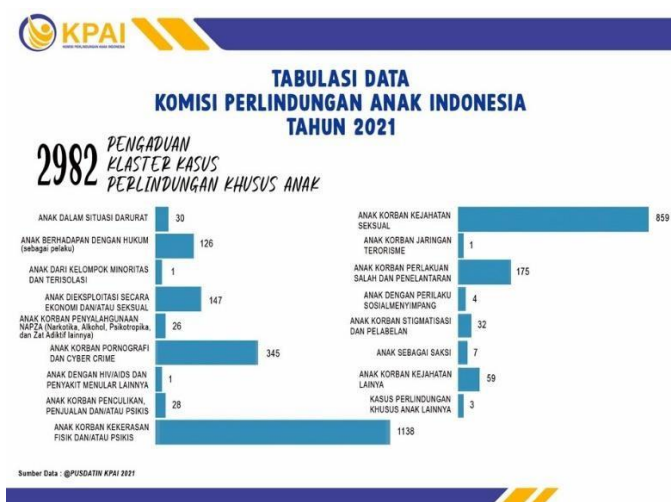
Gambar 2. Data Pengaduan Klaster Kasus Perlindungan Khusus Anak

Data Perhimpunan Dokter Forensik Indonesia menunjukkan bahwa sepanjang tahun 2021 tercatat ada 11.952 kasus kekerasan terhadap anak. Sementara itu, Data Pusdatin KPAI pada tahun 2021 menunjukkan, dari 2982 laporan pengaduan yang diterima pada klaster kasus perlindungan khusus anak, 1138 kasus merupakan laporan mengenai anak yang mengalami kekerasan baik psikis maupun fisik (Ulya, 2022).