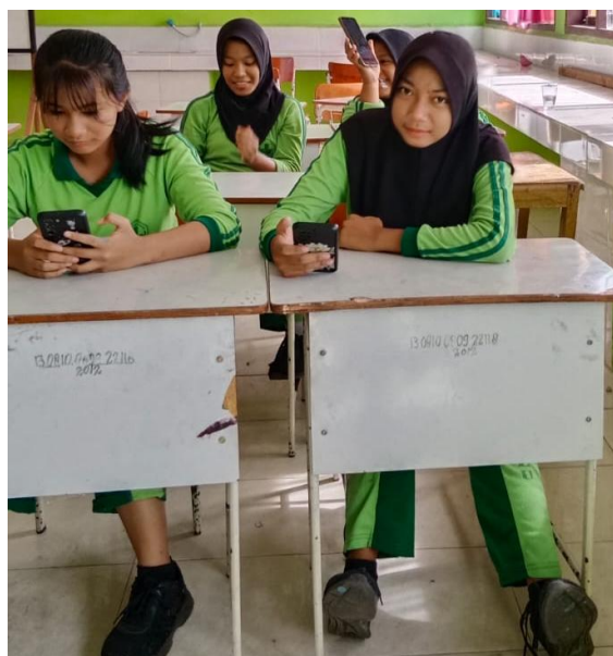
Gambar 2. Uji Praktikalitas Siswa

Gambar 2 memperlihatkan siswa yang memanfaatkan media e-learning IPA berbasis SETS. Siswa tampak terlibat dalam menilai kemudahan penggunaan, kemenarikan, dan kebermanfaatannya media pembelajaran digital tersebut melalui perangkat masing-masing. Kegiatan ini mencerminkan evaluasi langsung terhadap fitur, desain, dan alur materi pada e-learning. Lingkungan kelas yang tertata turut mendukung konsentrasi siswa dalam menilai sejauh mana media membantu pemahaman konsep IPA dan menghubungkannya dengan lingkungan, teknologi, dan masyarakat sesuai prinsip SETS. Dengan demikian, uji ini penting untuk memastikan media benar-benar praktis serta efektif digunakan pada proses pembelajaran.