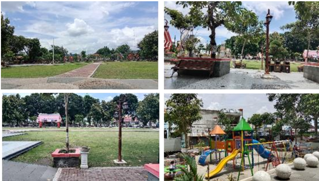
Gambar 5. Karakteristik Taman Alun-Alun Klaten