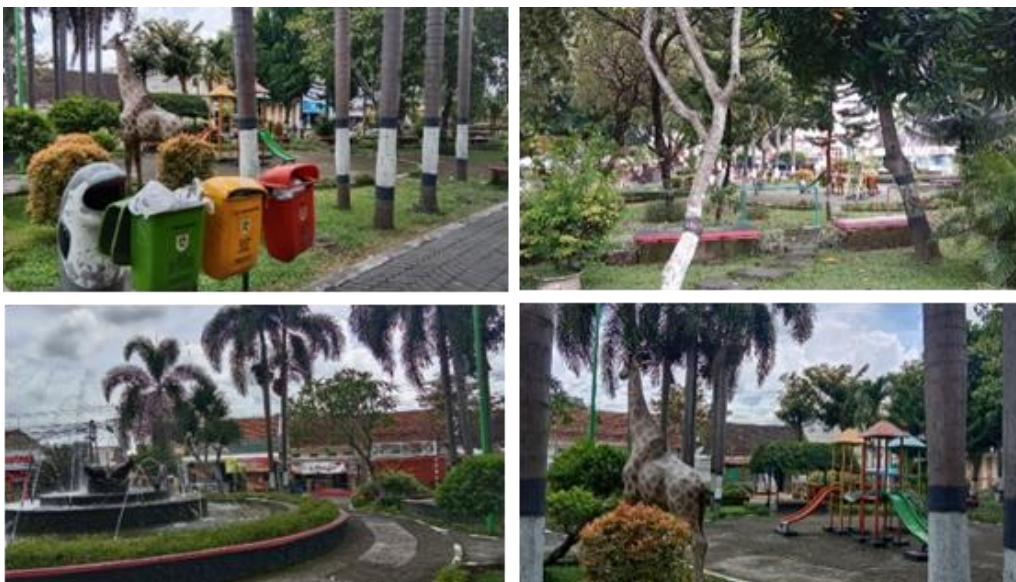
Gambar 6. Karakteristik Taman Kota Klaten

Taman Kota Klaten berlokasi di Jl. Pemuda, Kecamatan Klaten Utara. Taman ini berada pada koordinat 7^{\circ}42'18.83''\text{LS} - 7^{\circ}42'20.62''\text{LS} dan 110^{\circ}36'4.11''\text{BT} - 110^{\circ}36'5.91''\text{BT} . Taman Kota Klaten memperoleh total skor 24 yang berarti karakteristik taman ini termasuk pada kategori baik. Sebagian besar fasilitasnya berada pada kondisi yang baik dan terawat. Terdapat penjaga keamanan yang rutin berjaga di posko keamanan sehingga tidak ada kriminalitas yang terjadi. Akan tetapi tidak ada pagar pembatas. Vegetasi yang ada di Taman Kota Klaten beragam dan terawat. Area taman terlihat bersih dan pemeliharaannya terawat. Petugas DLH Kabupaten Klaten rutin membersihkan area taman dan pengunjung memiliki kesadaran akan kebersihan yang tinggi. Banyak tempat duduk nyaman yang tersedia dan berada dalam kondisi baik. Fasilitas bermain anak berada dalam kondisi baik. Sanitasi seperti toilet dalam kondisi kurang terawat dan kurang bersih. Terdapat wastafel akan tetapi tidak berfungsi dengan baik. Jalur aksesibilitas cukup baik akan tetapi masih ada keterbatasan bagi penyandang disabilitas. Fasilitas olahraga tersedia dalam jumlah terbatas dan dalam kondisi tidak terawat. Keberadaan tempat parkir dalam kapasitas yang terbatas. Terdapat beberapa aktivitas ekonomi di Taman Kota Klaten akan tetapi kurang terkelola dengan baik. Karakteristik Taman Kota Klaten ditampilkan pada Gambar 6.