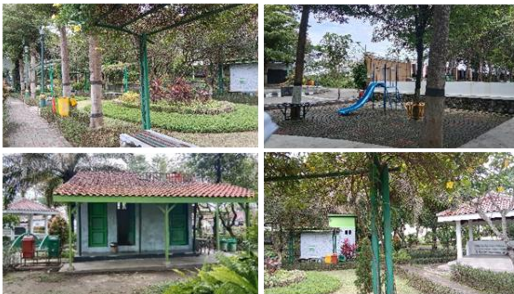
Gambar 7. Karakteristik Taman Gayamprit

Taman Gayamprit berlokasi di Jl. Merbabu No.16, Gayamprit, Kecamatan Klaten Selatan. Taman ini berada pada koordinat 7^{\circ}42'15.52'' LS – 7^{\circ}42'16.98'' LS dan 110^{\circ}35'49.03'' BT – 110^{\circ}35'51.23'' BT. Taman Gayamprit memperoleh total skor 19 yang berarti karakteristik taman ini termasuk pada kategori buruk. Sebagian besar fasilitasnya berada pada kondisi yang kurang baik. Tidak terdapat penjaga keamanan meskipun kriminalitasnya rendah. Selain itu terdapat pagar pembatas akan tetapi kurang berfungsi dengan baik. Jalur aksesibilitas cukup baik meskipun masih ada keterbatasan bagi penyandang disabilitas. Vegetasi yang ada di Taman Gayamprit beragam dan terawat. Kondisi lingkungan di Taman Gayamprit cukup bersih meskipun terdapat beberapa sampah di area taman. Tempat duduk yang disediakan hanya ada beberapa dan kenyamanannya kurang. Fasilitas bermain anak dalam kondisi yang sangat terbatas. Tidak terdapat fasilitas olahraga dan wastafel. Fasilitas sanitasi seperti toilet dan tempat pembuangan sampah dalam kondisi terbatas kebersihannya. Di Taman Gayamprit tidak terdapat keberadaan tempat parkir maupun aktivitas ekonomi di sekitarnya.