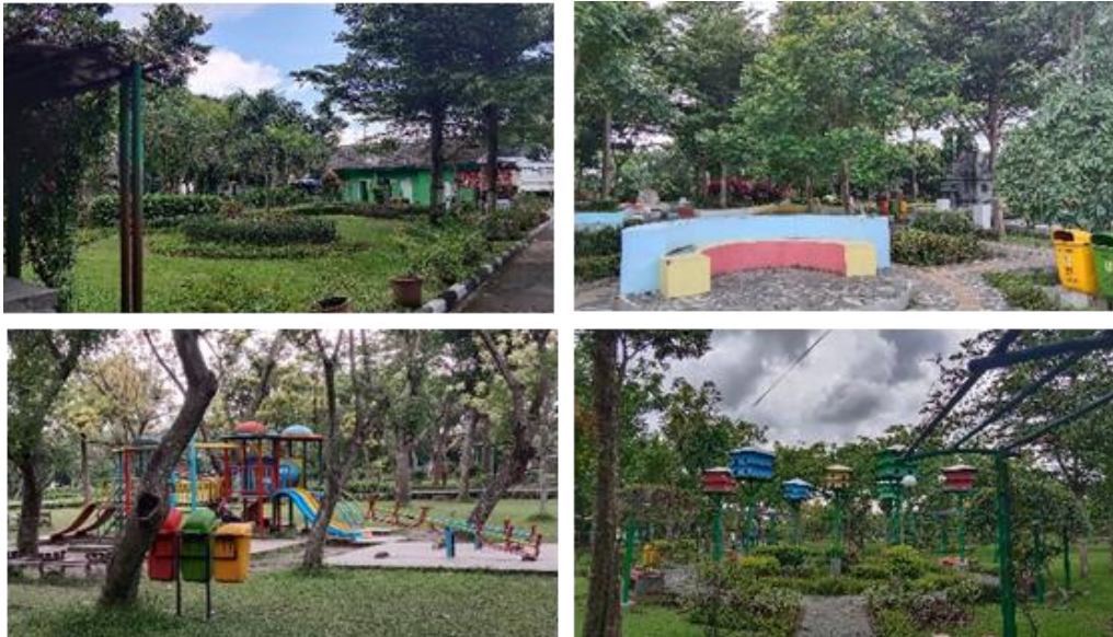
Gambar 2. Karakteristik Taman Gergunung