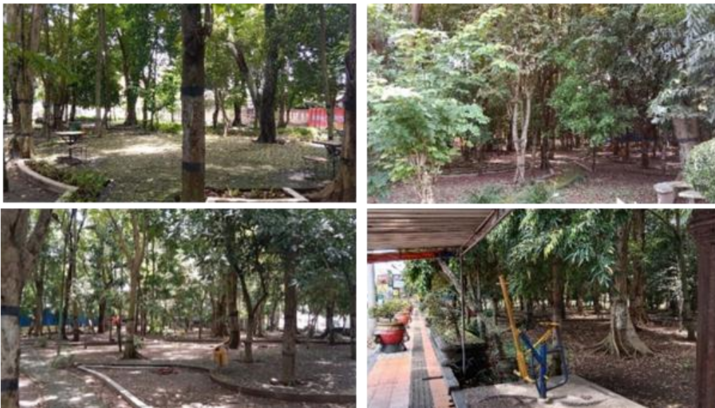
Gambar 4. Karakteristik Hutan Kota Sungkur

Hutan Kota Sungkur berlokasi di Jl. Andalas, Tegalputihan, Bareng, Kecamatan Klaten Tengah. Hutan Kota ini berada pada koordinat 7^{\circ}41'49'' LS – 7^{\circ}41'52'' LS dan 110^{\circ}36'14'' BT – 110^{\circ}36'18'' BT. Hutan Kota Sungkur memperoleh total skor 13 yang berarti karakteristik taman ini termasuk pada kategori buruk. Sebagian besar fasilitasnya berada pada kondisi yang buruk dan tidak terawat. Tidak terdapat penjaga keamanan dan jarang ada pengunjung yang datang. Selain itu tidak terdapat pagar pembatas. Vegetasi yang ada di Hutan Kota Sungkur beragam akan tetapi pemeliharannya tidak konsisten dan beberapa tanaman terlihat kurang sehat. Kebersihan dan pemeliharaan Hutan Kota Sungkur sangat minim, area hutan kota terlihat kotor dan sampah berserakan. Tidak ada tempat parkir dan fasilitas sanitasi seperti toilet serta wastafel yang tersedia. Tempat pembuangan sampah disediakan akan tetapi dalam jumlah terbatas dan kondisinya rusak. Jalur aksesibilitas tidak baik dan masih ada keterbatasan bagi penyandang disabilitas. Tidak ada tempat duduk yang disediakan. Fasilitas bermain anak hanya berjumlah terbatas dan tidak terawat dan fasilitas olahraga dalam kondisi rusak parah. Selain itu aktivitas ekonomi yang ada di Hutan Kota Sungkur tidak dikelola dengan baik.