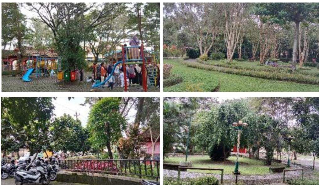
Gambar 3. Karakteristik Taman Lampion

Taman Lampion berlokasi di Gg. Tidar, Barenglor, Bareng Lor, Kecamatan Klaten Utara. Taman ini berada pada koordinat 7^{\circ}41'35'' LS – 7^{\circ}41'40'' LS dan 110^{\circ}36'26'' BT – 110^{\circ}36'32'' BT. Taman Lampion memperoleh total skor 28 yang berarti karakteristik taman ini termasuk pada kategori baik. Sebagian besar fasilitasnya berada pada kondisi yang baik dan terawat. Terdapat penjaga keamanan yang berjaga di posko keamanan pada waktu tertentu. Tidak ada kriminalitas yang terjadi meskipun cakupan area pengawasannya kurang. Di Taman Lampion pagar pembatas tidak berfungsi dengan baik. Keberadaan tempat parkir memadai. Vegetasi yang ada di Taman Lampion beragam dan terawat. Area taman terlihat bersih dan pemeliharannya terawat. Petugas DLH Kabupaten Klaten rutin membersihkan area taman dan pengunjung memiliki kesadaran akan kebersihan yang tinggi. Tempat duduk yang tersedia terbatas dan kurang nyaman. Fasilitas bermain anak terbatas dan sanitasi seperti toilet dalam kondisi terawat dan bersih. Ketersediaan air bersih (Wastafel) juga memadai. Jalur aksesibilitas cukup baik akan tetapi masih ada keterbatasan bagi penyandang disabilitas. Fasilitas olahraga tersedia dalam jumlah terbatas dan kondisinya kurang terawat. Terdapat beberapa aktivitas ekonomi yang ada di Taman Lampion akan tetapi kurang terorganisir.