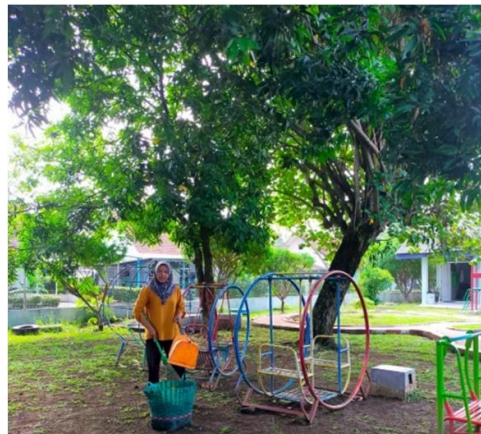
Gambar 4. Pemeliharaan Harian