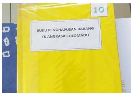
Gambar 6. Buku Penghapusan Sarana dan Prasarana

Secara manajerial, penghapusan sarana dan prasarana bertujuan untuk mengeliminasi aset yang tidak lagi menunjang kegiatan pendidikan. Tahapan ini dilaksanakan melalui proses seleksi yang ketat untuk menentukan status kelayakan barang, sehingga aset yang tidak produktif dapat dikeluarkan dari catatan inventaris melalui prosedur penghapusan data. Kebijakan penghapusan sarana di TK Angkasa didasarkan pada kondisi kerusakan aset yang menghambat fungsinya, seperti buku yang tidak utuh atau papan alas balok yang membahayakan keselamatan peserta didik. Penggantian aset yang mengalami kerusakan berulang dilakukan untuk efisiensi anggaran dan mencegah pemborosan biaya pemeliharaan. Secara prosedural, setiap tindakan penghapusan wajib laporan kepada pihak yayasan dan didokumentasikan dalam buku penghapusan sekolah sebagai bentuk tertib administrasi. Dapat dilihat pada Gambar 6 berikut.