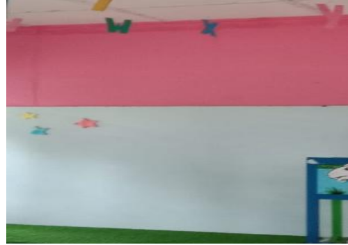
Gambar 2d. Pengadaan Sekat Ruang