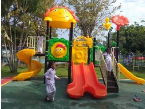
Gambar 2c. Pengadaan Playground