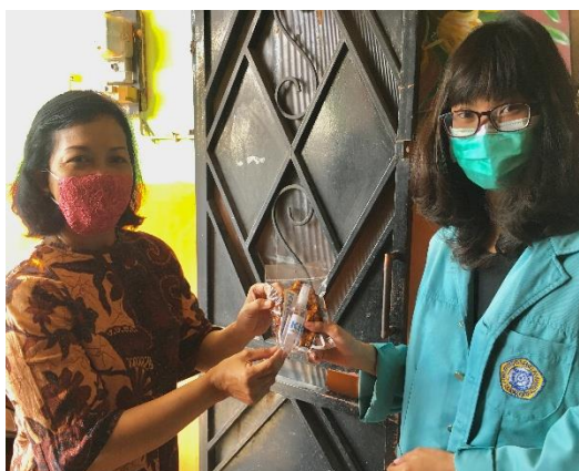
Gambar 1.2 Memberikan masker Bersama ibu RT 02 RW 09