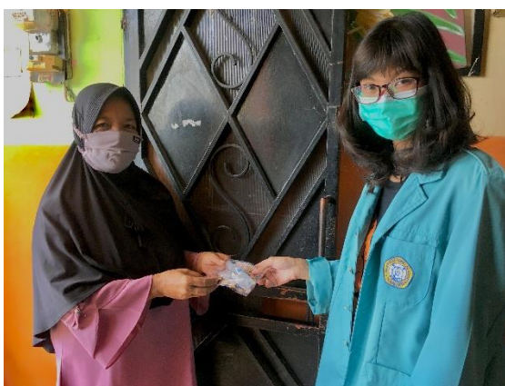
Gambar 1.3 Memberikan masker bersama ibu RW 09

Program edukasi menggunakan masker dengan benar dan menggunakan handsanitizer merupakan salah satu upaya untuk meminimalisir dan mencegah Virus COVID-19 semakin menyebar di RT 02 RW 09 Sumber Dukuhan. Kegiatan KKN COVID 19 dilakukan dengan membagikan masker dan handsanitizer kepada warga RT 02 RW 09 terutama pada saat perkumpulan arisan ibu-ibu PKK sembari diberikan edukasi tentang manfaat menggunakan masker dan handsanitizer untuk mencegah COVID-19.