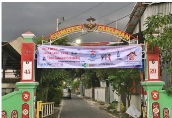
Gambar 1.4 Pemasangan mmt di gapura Jalan kahuripan RT 02 RW 09

harapannya dengan pemasangan mmt bisa menjadi pengingat warga ketika melintas dan melihat mmt yang ada untuk selalu mematuhi protokol kesehatan, tidak hanya pemasangan mmt saja penulis juga melakukan pemasangan beberapa poster-poster tentang cara mencuci tangan, menggunakan masker yang benar, dan juga pola hidup sehat. Poster dibuat semenarik mungkin dengan memberikan gambar-gambar dan sedikit kata-kata agar warga tidak bosan melihatnya.