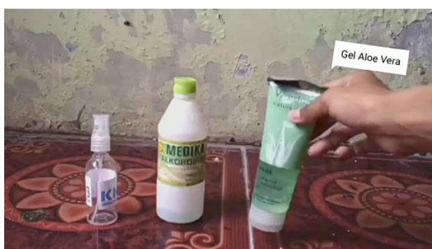
Gambar 1.1 Bahan pembuatan handsanitizer