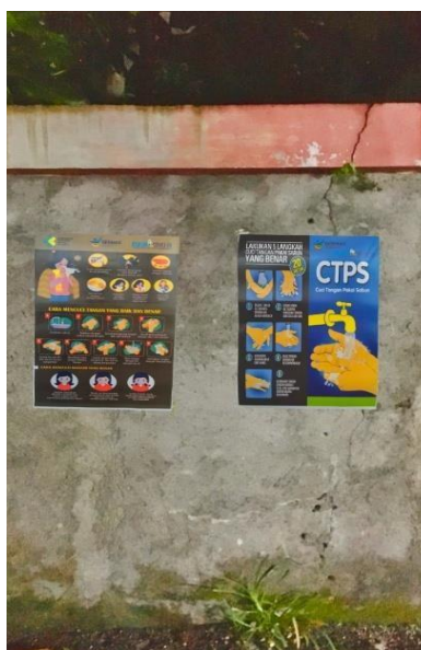
Gambar 1.5 Pemasangan poster

Program yang terakhir dilakukan yaitu melakukan pemasangan poster mengenai pola hidup sehat dan menjalankan new normal (pola kehidupan baru) new normal disini maksudnya adalah mulai membiasakan diri untuk hidup sehat dimulai dari selalu mencuci tangan sebelum melakukan kegiatan, selalu