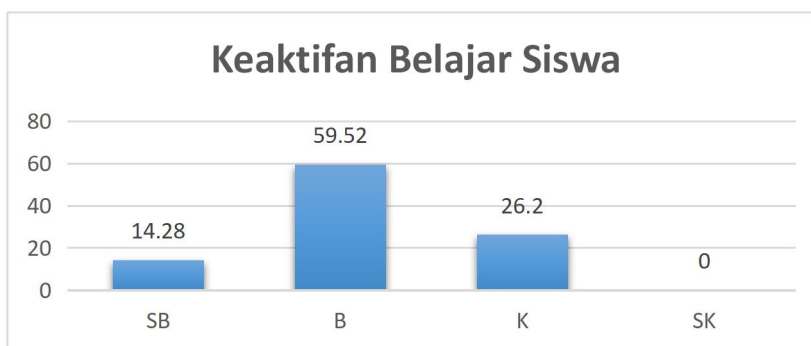
Gambar 4.1 Grafik Keaktifan Belajar Siswa Siklus I

Berdasarkan sajian data diatas, dapat ditarik kesimpulan bahwa keaktifan siswa kelas X OTKP 1 belum mencapai target. Perhitungan ketuntasan yaitu dari presentase jumlah siswa yang minimum mendapat kategori baik dibagi dengan seluruh jumlah siswa. Berdasarkan data yang diperoleh, siswa memperoleh ketuntasan 73.8% yang berarti keaktifan belajar siswa X OTKP 1 SMK Batik 1 Surakarta pada mata pelajaran Ekonomi Bisnis pada siklus I sudah mengalami peningkatan, namun belum mencapai target.