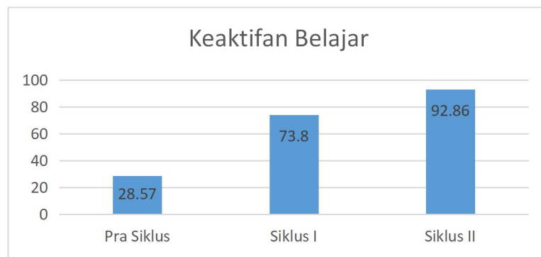
Gambar 4.4 Grafik Perbandingan Capaian Hasil Pengukuran Belajar Siswa antar Siklus

Berdasarkan gambar 4.4 dapat ditarik kesimpulan bahwa terdapat peningkatan dari pra siklus, siklus I, dan siklus II. Hasil keaktifan belajar siswa pada pra siklus tergolong rendah yaitu sebesar 28.57%. Setelah dilakukan tindakan dengan penerapan model pembelajaran Jigsaw dan Talking Stick terjadi peningkatan keaktifan belajar siswa yaitu pada siklus I menjadi 73.80% dan pada siklus II menjadi 92.86%. Wawancara yang dilakukan dengan guru mata pelajaran ekonomi bisnis diakhir pembelajaran siklus I dan siklus II dijadikan sumber data selain data observasi. Hasil wawancara yang telah dilakukan menunjukkan hasil yang positif, yang berarti bahwa wawancara dapat memperkuat hasil observasi, sehingga hasil yang diperoleh bersifat valid. Secara umum, hasil penilaian keaktifan belajar siswa berdasarkan hasil observasi dan wawancara dengan guru mata pelajaran ekonomi bisnis menunjukkan bahwa model pembelajaran Jigsaw dan Talking Stick dapat meningkatkan keaktifan belajar siswa.