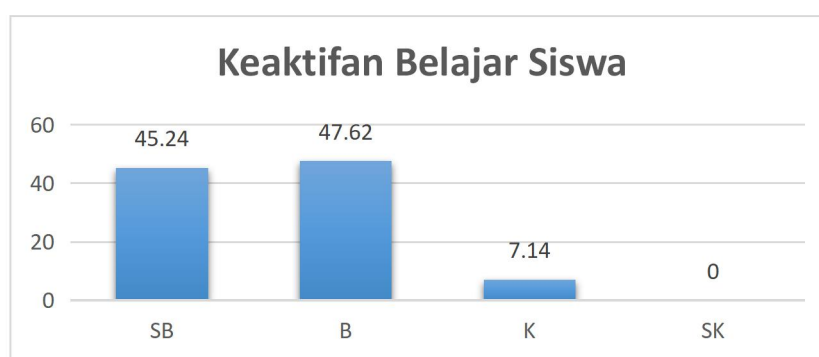
Gambar 4.2 Grafik Keaktifan Belajar Siswa Siklus II

Berdasarkan sajian data diatas, dapat ditarik kesimpulan bahwa keaktifan siswa kelas X OTKP 1 sudah mencapai target. Perhitungan ketuntasan yaitu dari presentase jumlah siswa yang minimum mendapat kategori baik dibagi dengan seluruh jumlah siswa. Berdasarkan data yang diperoleh, siswa memperoleh ketuntasan 92.86% yang berarti keaktifan belajar siswa X OTKP 1 SMK Batik 1 Surakarta pada mata pelajaran Ekonomi Bisnis pada siklus I sudah mencapai target dan mengalami peningkatan dari siklus I.