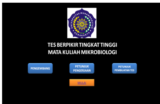
Gambar 1. Homeview

Produk instrumen tes yang sudah layak dan efektif didiseminasikan kepada dosen. Diseminasi dibantu dosen biologi untuk menyebarkan dan menularkan kepada dosen lain. Dosen biologi antusias untuk belajar membuat instrumen tes yang dikembangkan. Instrumen tes yang dikembangkan disertai petunjuk untuk membuat instrumen yang dikembangkan sehingga memudahkan dosen untuk membuat instrumen yang sama pada materi yang lain bahkan mata kuliah lain. Tampilan produk akhir dapat dilihat pada Gambar 1 hingga Gambar 5.