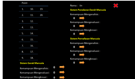
Gambar 3. Profilview

Gambar 2 Worksheet merupakan halaman kerja tes dimana terdapat tombol untuk membaca soal dan tombol untuk menjawab.