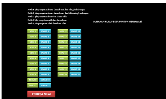
Gambar 2. Worksheet

Gambar 1 Homeview merupakan tampilan utama ketika tes pertama kali dijalankan yang terdapat beberapa tombol menu pilihan.