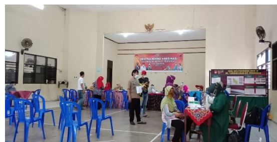
Gambar 4. Proses pelaksanaan vaksinasi