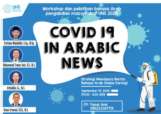
Gambar 4: leaflet acara pelatihan bahasa Arab