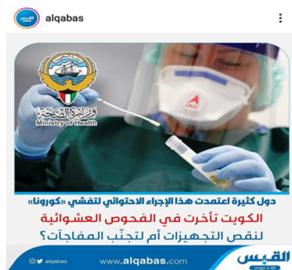
Gambar 2: Contoh gambar susunan berita on-line covid 19