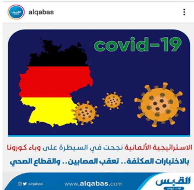
Gambar 1. Contoh berita on line bahasa Arab tentang covid 19.

as-saitharah 'alā wabāi kūrūna/ . Dalam berita tersebut dijelaskan bahwa strategi yang selama ini digunakan oleh negara Jerman / al-almāniyyah / telah berhasil / najaḥat / dalam pengendalian / saitharah/ virus / wabāi/ korona. Melalui pengabdian masyarakat dengan sistem penguasaan ini, tim P2M UNS akan menggandeng mitra para guru bahasa Arab dalam menerjemahkan berita-berita terkait virus corona/ covid 19 agar dapat dikonsumsi berita dalam bahasa Arab tersebut oleh masyarakat Indonesia. Selain itu, optimalisasi pembelajaran daring yang selama ini dirasa masih lemah dan belum maksimal perlu untuk diberikan “ruh” baru agar SPADA UNS dan OCW UNS dapat menjadi salah satu garda depan dalam pembelajaran jarak jauh on line di tengah-tengah pandemi covid 19 ini.