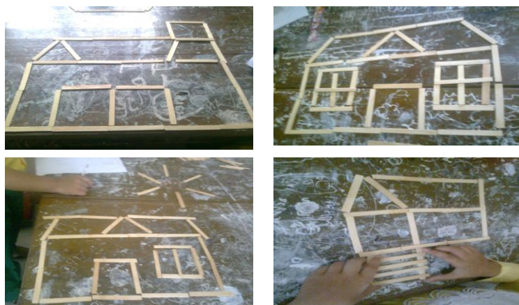
Gambar 3. Beberapa hasil kerja siswa berupa bangun berbentuk rumah dari stik es krim

Pada kegiatan ini guru menjelaskan kepada siswa bahwa masing-masing kelompok akan diberi 50 stik es krim. Stik tersebut dapat digunakan untuk membuat beberapa model rumah yang harus memuat bangun geometri. Gambar 3 berikut menunjukkan aktivitas siswa pada sesi ini.