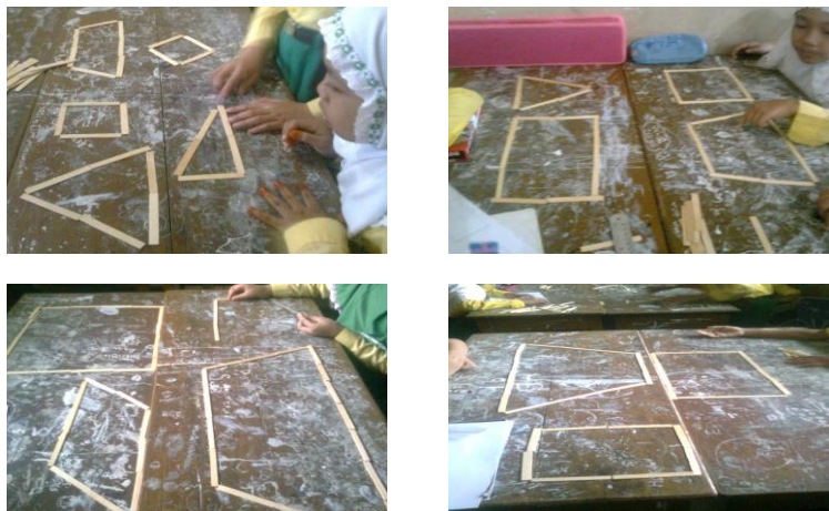
Gambar 1. Beberapa bangun geometri dari hasil kerja siswa menggunakan stik es krim

Kegiatan ini dilakukan untuk mengetahui bagaimana kreativitas dan pemahaman pemahaman siswa terhadap konsep bangun geometri. Sebelumnya siswa dibagi dalam tujuh kelompok yang masing-masing kelompok terdiri dari 4 siswa. Setiap kelompok mendapat lima puluh stik es krim. Dari media yang ada, siswa diminta membuat minimal tiga bangun geometri. Beberapa hasil aktivitas siswa dalam membuat bidang geometri dengan menggunakan stik es krim sebagaimana ditunjukkan pada Gambar 1.