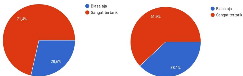
Gambar 4. Antusiasme mahasiswa terhadap program MBKM

Persepsi sebagian besar mahasiswa Pendidikan Guru Sekolah Dasar (PGSD) tertarik untuk bisa memahami secara detail terhadap implementasi MBKM dengan presentase 90,5% dan berkeinginan merekomendasikan program MBKM ini untuk kolega/saudara dengan dibuktikan data yang menunjukkan presentase sebesar 61,9% disertai meningkatnya jumlah dan kualitas mahasiswa yang mengikuti program merdeka belajar kampus merdeka setiap semesternya.