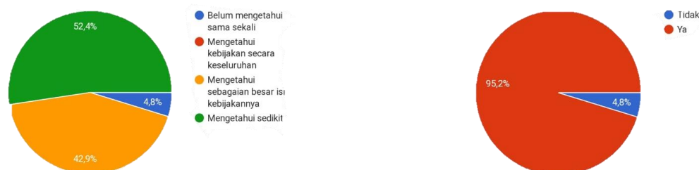
Gambar 1. Pengetahuan mahasiswa terhadap MBKM