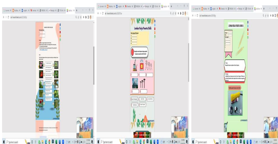
Gambar 3. Tampilan LKPD Liveworksheets

Kemudian Isikan data yang diminta, meliputi judul, materi, deskripsi hingga penggunaan file yang sudah kita buat, lalu save. Berikut contoh tampilan LKPD Liveworksheet.