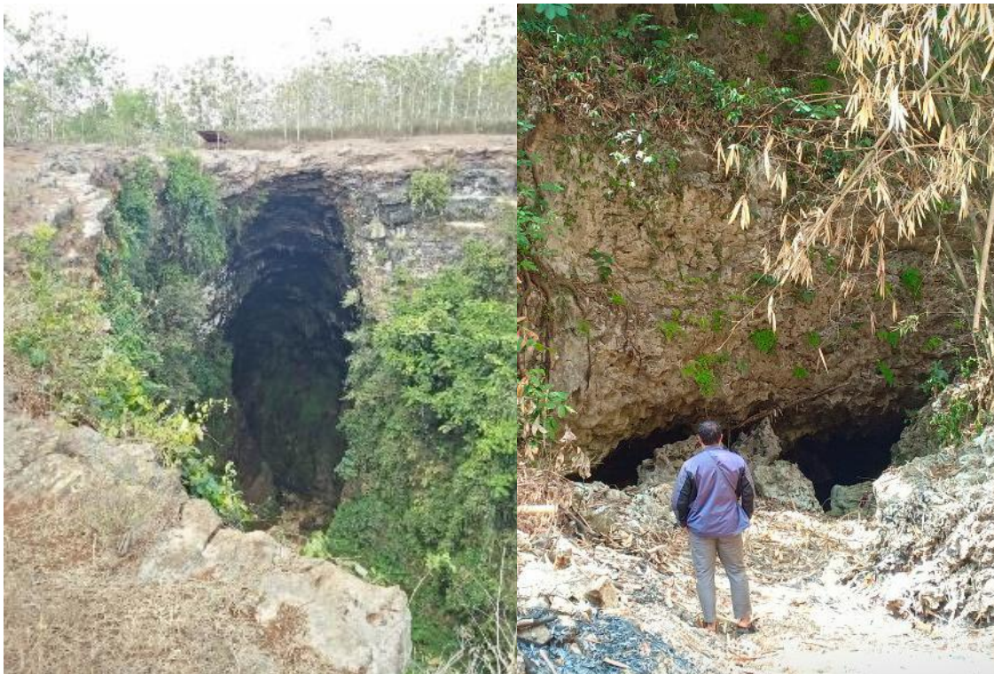
Gambar 2. Ponor yang Menjadi Jalan Masuk Sungai Alogenik Menuju ke Sungai Bawah Tanah Karst (a) Ponor Ngeleng sebagai Outlet dari Sungai Alogenik Kepuh, Paliyan, Gunungkidul (Kiri) dan (b) Ponor Seropan yang Merupakan Salah Satu Ponor pada Sistem Sungai Alogenik Kedungparan, Ponjong, Gunungkidul (kanan)

Imbuhan alogenik yang masuk melalui ponor (Gambar 2) menyebabkan kerentanan airtanah di kawasan karst menjadi sangat tinggi (Cahyadi dan Hartoyo, 2011). Kondisi ini terjadi karena air dari sungai alogenik akan masuk ke dalam sistem sungai bawah tanah karst tanpa mengalami proses filtrasi (penyaringan) oleh tanah (Cahyadi dkk., 2013). Kondisi berbeda terjadi jika imbuhan airtanah karst berasal dari air hujan yang meresap melalui epikarst dan sistem diffuse yang memungkinkan terjadinya filtrasi secara alamiah oleh tanah dan butir batuan.