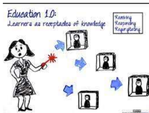
Gambar 2 Education 1.0 guru sebagai pusat informasi

Berdasarkan display pada gambar 1 nampak bahwa Education 4.0 menuntut adanya Teknologi yang digunakan Faster, Smarter, dan Better. Maksudnya adalah keterbaruan atau perkembangan teknologi harus dimanfaatkan di dalam pelaksanaan pendidikan. Guru harus mampu memberikan fasilitas yang sesuai dengan tuntutan zaman. Faktanya guru masih melakukan evaluasi secara konvensional yakni dengan memberikan hardfile atau berkas soal atau dapat dikatakan masih konvensional. Hal ini juga dipengaruhi dari cara mengajar guru yang juga masih konvensional sebagai penggambaran ilustrasi dibawah ini: