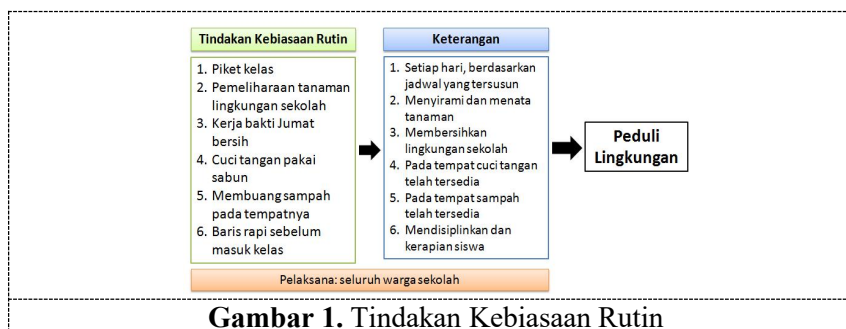
Gambar 1. Tindakan Kebiasaan Rutin

Gambar 1. Menunjukkan tindakan kebiasaan rutin yang dilaksanakan dalam membangun budaya peduli lingkungan. Tindakan dikatakan kebiasaan rutin karena dilaksanakan menerus yang