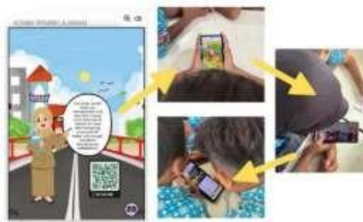
Gambar 8 Komik Digital Berintegrasi Gamifikasi

Dilihat dari sudut pandang gamifikasi, sarana pembelajaran memperlihatkan tingkat efektivitas yang tinggi karena peserta didik dapat dengan mudah mengerjakan kuis digital melalui pemindaian kode QR yang terdapat di dalam komik. Peserta didik dapat memahami petunjuk pengerjaan soal dengan baik, menyelesaikan kuis baik secara individual maupun dalam grup, serta mengikuti alur permainan tanpa mengalami masalah teknis yang signifikan.