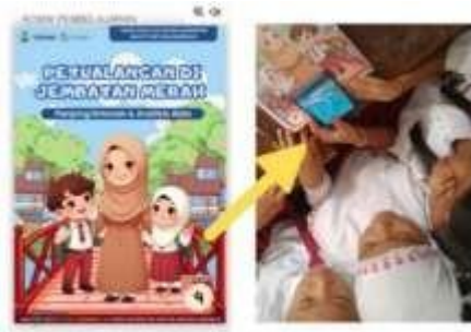
Gambar 6 Komik Digital berbasis Augmented Reality (AR)

Penyampaian elemen budaya setempat melalui gambar, karakter, dan alur cerita mempermudah siswa dalam mengerti materi secara lebih jelas dan relevan. Siswa tidak mengalami kesulitan dalam mengikuti narasi dan mengerti arahan yang disampaikan, sehingga pengajar tidak perlu memberikan penjelasan tambahan secara terus-menerus.