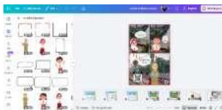
Gambar 4 Media Pembelajaran Interaktif Yang Dibuat Dari Aplikasi Canva

Tahap design adalah fase merancang produk berdasarkan hasil analisis kebutuhan dari tahap definisi. Pada tahap area ini, peneliti secara konseptual dan teknis mengembangkan media pembelajaran berupa komik digital etnomatematika yang memanfaatkan Augmented Reality (AR) dan elemen gamifikasi, sehingga produk tersebut bisa selaras dengan tujuan pembelajaran, karakteristik siswa, serta aspek visual media. Secara rinci, kegiatan dalam tahap desain mencakup (a) Pembuatan konsep dan alur cerita komik digital, (b) Penyusunan storyboard dan struktur halaman, (c) Desain tampilan visual (font, warna, dan latar belakang), (d) Integrasi Augmented Reality (AR), (e) Penambahan unsur gamifikasi, dan (f) Penyusunan instrumen penelitian.