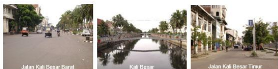
Gambar 1. Gambaran Umum Jalan Kali Besar Barat, Kali Besar, dan Jalan Kali Besar Timur