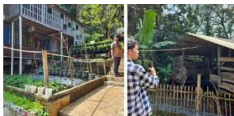
Gambar 7. Salah Satu Area Berkebun dan Kandang Ternak

Area berkebun disediakan cukup banyak oleh sekolah agar siswa dapat belajar menanam, memberikan pengalaman langsung dalam merawat alam dan memahami siklus kehidupan tumbuhan. Selain itu, sekolah juga mengembangkan area peternakan sederhana yang dapat dikelola oleh siswa (Gambar 7).