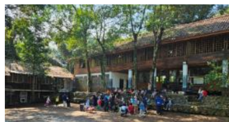
Gambar 5. Nuansa Pembelajaran di Sekolah Alam

Bangunan dan ruang belajar di Sekolah Alam Bandung dirancang untuk menyatu dengan alam, mencerminkan filosofi pendidikan yang berbasis keberlanjutan (Gambar 5). Penggunaan material kayu dan bambu sebagai struktur utama, serta tipologi rumah panggung dengan bukaan alami, memperkuat keterhubungan antara ruang belajar dan lingkungan sekitar. Desain seperti ini sejalan dengan konsep The Teaching Green School Building (TGB), yang menekankan pentingnya kualitas lingkungan fisik seperti penerapan konsep arsitektur alami dalam mendukung pembelajaran berbasis alam serta edukasi ramah lingkungan (Kong dkk., 2015; Lippman, 2013).