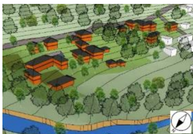
Gambar 10. Visualisasi Penempatan Massa Bangunan Sekolah Alam Bandung

Penempatan massa bangunan tidak kaku dan cenderung organik mengikuti kualitas kontur alami. Gambar 10 menunjukkan penempatan massa bangunan Sekolah Alam Bandung yang mengikuti kontur alami dan meminimalisasi rekayasa lahan ( cut and fill ).