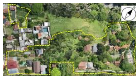
Gambar 9. Tapak Sekolah Alam Bandung yang Didominasi Area Hijau

Sekolah harus ditempatkan pada kawasan yang relatif asri, bebas dari hiruk-pikuk kota (Sekolah Alam Bandung berjarak \pm 400\text{m} dari jalan raya), serta dikelilingi vegetasi alami yang masih terjaga (Gambar 9). Kondisi tapak tersebut tidak hanya menciptakan suasana belajar yang tenang dan nyaman, tetapi juga menghadirkan alam yang masih asri sebagai bagian tidak terpisahkan dari proses pendidikan.