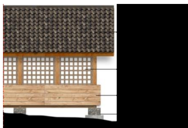
Gambar 11. Model Bangunan Ruang Kelas di Sekolah Alam Bandung

Aspek struktur dan material menjadi bagian penting dari konsep bangunan berkelanjutan. Sekolah menerapkan sistem struktur rangka ringan dengan sistem panggung untuk menjadikan tanah di bawah bangunan tetap berfungsi sebagai area resapan air (Gambar 11). Konsep struktur ini diterapkan pada hampir seluruh bangunan di Sekolah Alam Bandung.