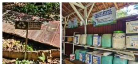
Gambar 8. Area TPS Sekolah

Sesuai dengan keterangan pihak sekolah, pengolahan limbah juga menjadi bagian penting dalam keseharian siswa. Sekolah memiliki area khusus pengolahan sampah (TPS) yang dilengkapi dengan tempat sampah terpilah, fasilitas komposter, bahkan insinerator (Gambar 8). Siswa diberikan jadwal piket berkelompok dan wajib memindahkan sampah ke TPS setelah kegiatan belajar. Kantin sekolah juga mendukung prinsip keberlanjutan dengan mendorong penggunaan bahan yang dapat didaur ulang dan melarang penggunaan plastik sekali pakai pada acara tertentu. Upaya ini membentuk kebiasaan hidup sehat dan ramah lingkungan, yang diperkuat melalui informasi faktual serta praktik langsung, sesuai dengan pendekatan TGB dalam membangun kesadaran lingkungan di kalangan siswa (Brković dkk., 2015; Cole, 2014).