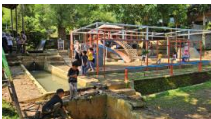
Gambar 6. Ruang Bermain di Sekolah Alam

Pada dimensi “Latar Aktif” (LA), Sekolah Alam Bandung menyediakan fasilitas seperti lapangan olahraga dan area bermain untuk mendukung aktivitas fisik siswa. Lingkungan alami sekitar juga memungkinkan mereka memanfaatkan berbagai elemen seperti air, tanah, dan pepohonan untuk bermain serta belajar secara aktif (Gambar 6). Pendekatan ini sejalan dengan filosofi TGB di mana latar aktif dan interaksi langsung dengan alam menjadi bagian penting dari proses pembelajaran (Brković dkk., 2015; Cole, 2014; Lippman, 2013).