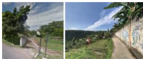
Gambar 4. Jalur Akses ke Sekolah Alam Bandung

Dimensi "Lingkungan Fisik" (LF) Sekolah Alam Bandung sangat mendukung konsep belajar dari alam karena tapaknya berlokasi di utara Kota Bandung yang berbukit dan kaya akan vegetasi. Karakteristik tapak ini sangat mendukung visi sekolah dan sejalan dengan nilai-nilai ekologis yang ingin ditanamkan ke peserta didik. Namun, hal ini memiliki konsekuensi akses sempit yang hanya dapat dilalui kendaraan roda dua atau pejalan kaki. Kualitas aksesibilitas ini kemungkinan dapat memengaruhi kenyamanan mobilitas dan daya tarik pengunjung (Hendradewi dkk., 2025; Membala dkk., 2025), serta dapat membatasi keterbukaan sekolah terhadap masyarakat (Gambar 4).