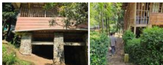
Gambar 3. Aplikasi Struktur dan Material

Selain itu, sebagian besar material yang digunakan pada bangunan sekolah merupakan material tradisional kayu atau bambu dengan konstruksi panggung yang ramah lingkungan (Gambar 3).