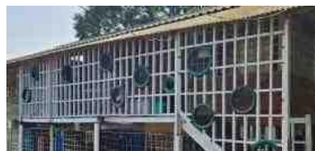
Gambar 12. Penggunaan Material Bekas sebagai Elemen Fasad

reuse, reduce, recycle . Contohnya penggunaan ban sepeda bekas sebagai aksen pada fasad (Gambar 12).