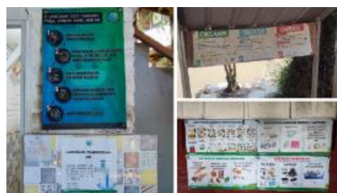
Gambar 2. Papan Informasi Edukatif pada Fitur-fitur Sekolah

Dimensi TGB di Sekolah Alam Bandung dijelaskan berdasarkan data observasi lapangan dan hasil wawancara kepada kepala bidang sarana dan prasarana sekolah. Pada dimensi “Informasi Faktual” (IF), Sekolah Alam Bandung telah berupaya menghadirkan berbagai media informasi yang mendukung pemahaman siswa terhadap lingkungan (Gambar 2). Elemen ini banyak ditemukan di titik-titik strategis dekat dengan fitur-fitur ramah lingkungan di sekolah. Beberapa pesan seperti imbauan cara mencuci tangan di dekat toilet atau panduan memilah sampah di area Tempat Pembuangan Sampah “ Reuse, Reduce, Recycle ” (TPS3R) terlihat jelas dan mudah dibaca.